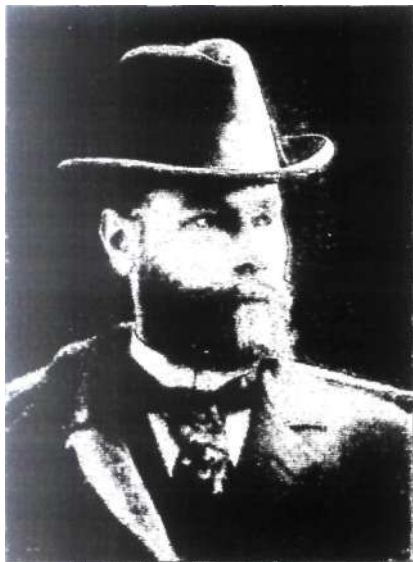
Академик архитектуры А. Н. Бекетов. 1916 г.

В период с 1904 по 1910 г. и преподавал студентам младших двух курсов и слушателям фармацевтических курсов курс «подания первой помощи до прибытия врача»; студентам IV курса — секционный