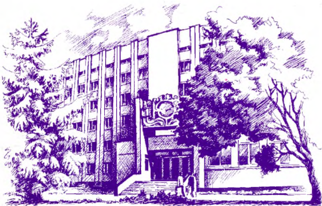
Морфологічний корпус УМСА