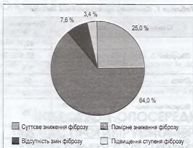
Рисунок 1. Варіанти змін стадії фіброзу під час ПВТ ХГС

2 — помірне зниження фіброзу (в середньому на 0,17 пункту за шкалою FibroTest або на один ступінь за шкалою METAVIR) — у 64 % хворих, 3 — незмінний ступінь фіброзу — 7,6 %, зростання фіброзу (в середньому на 0,24 пункту за шкалою FibroTest або до 1-го ступеня за шкалою METAVIR) — 3,4 % (рис. 1).