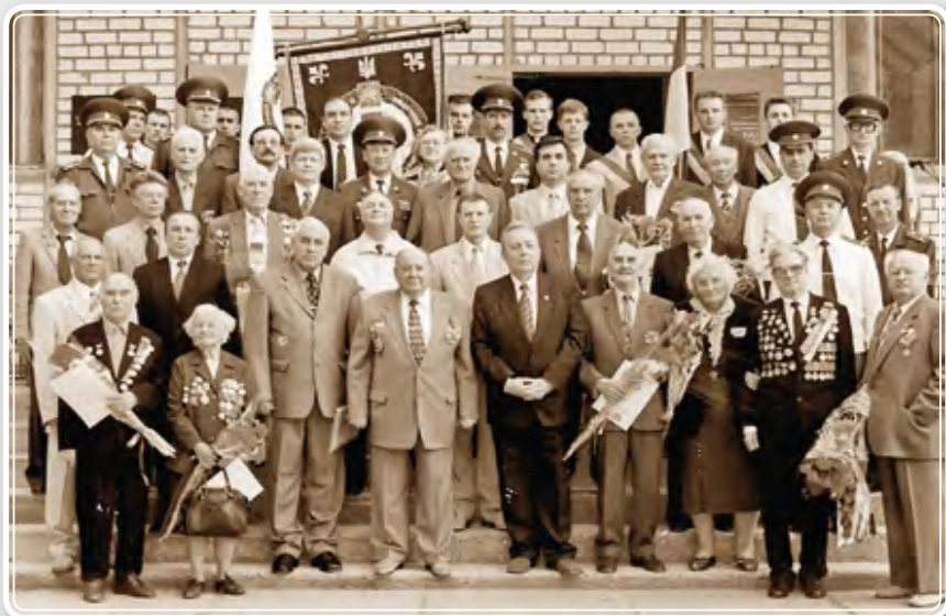
Ветерани війни з керівництвом і співробітниками університету (2004 р.)