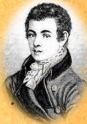
В.Н. Каразін Імператорський Харківський Університет