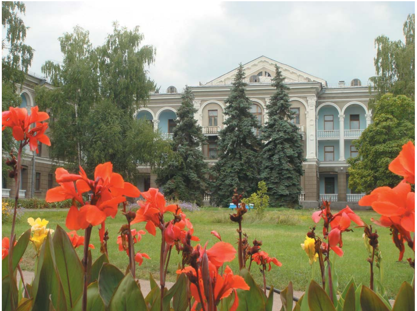
41 Время остановилось – во дворе санатория «Конча-Заспа». Украина, 2013