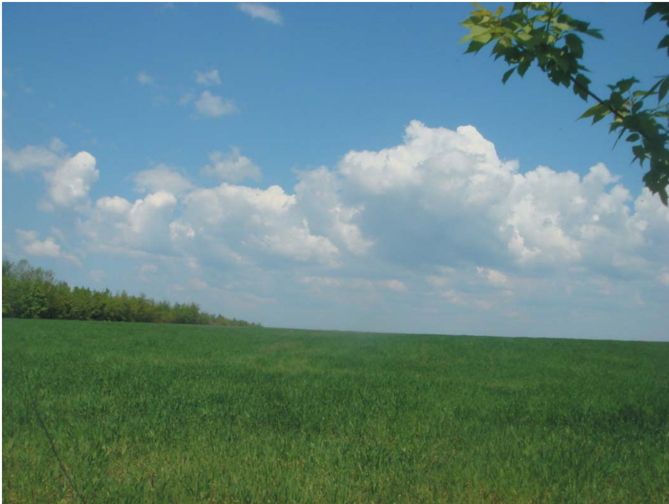
12 Весеннее поле, где-то посередине между Киевом и Одессой. Украина, 2009