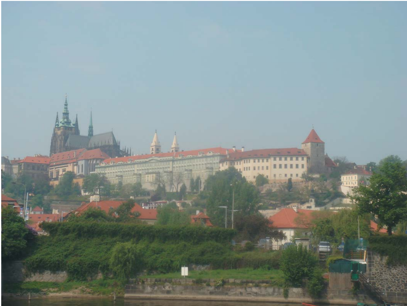
10 Пражский Град на холме. Прага, Чехия, 2009