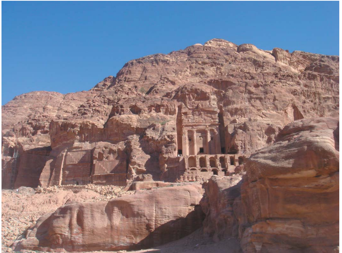
19 Развалины древнего города. Петра, Иордания, 2010