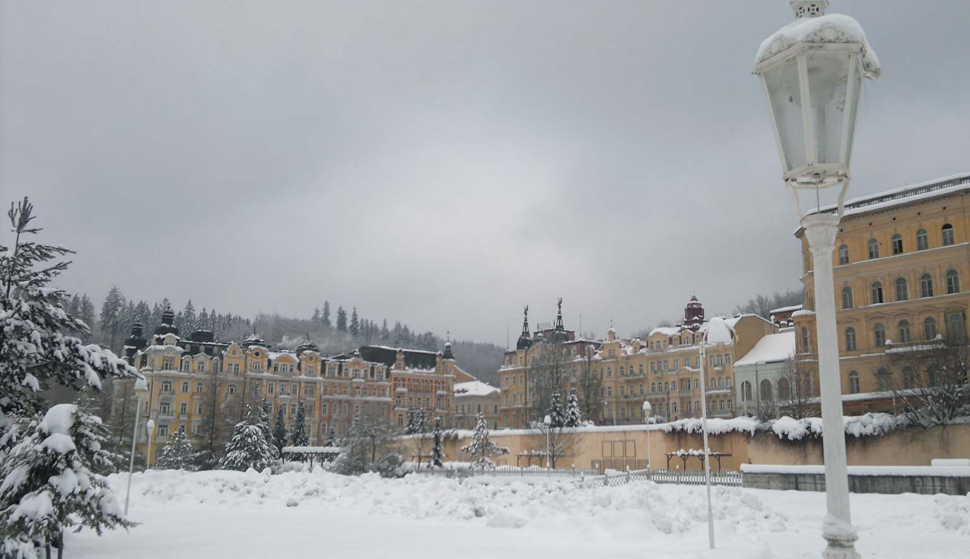
29 Ель и фонарь. Марианские Лазни, Чехия, 2011