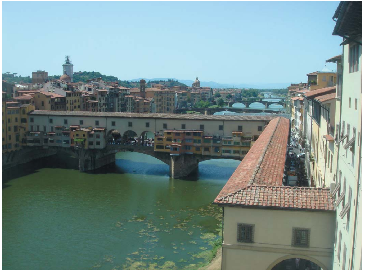
17 Мосты через реку Арно. Флоренция, Италия, 2009