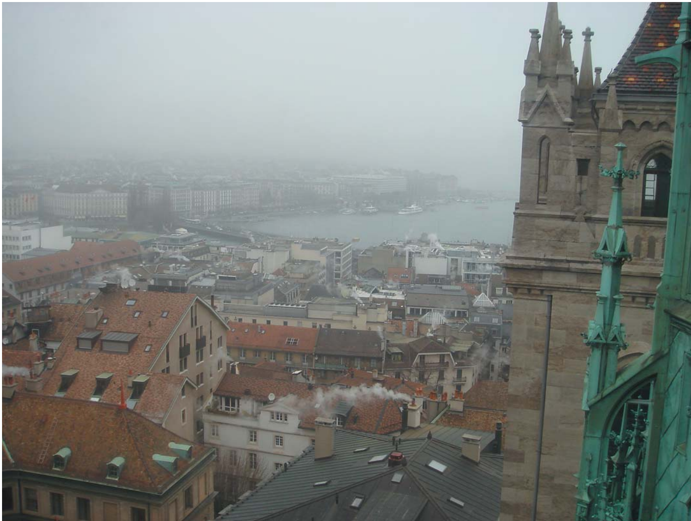
8 Крыши утреннего города. Женева, Швейцария, 2009