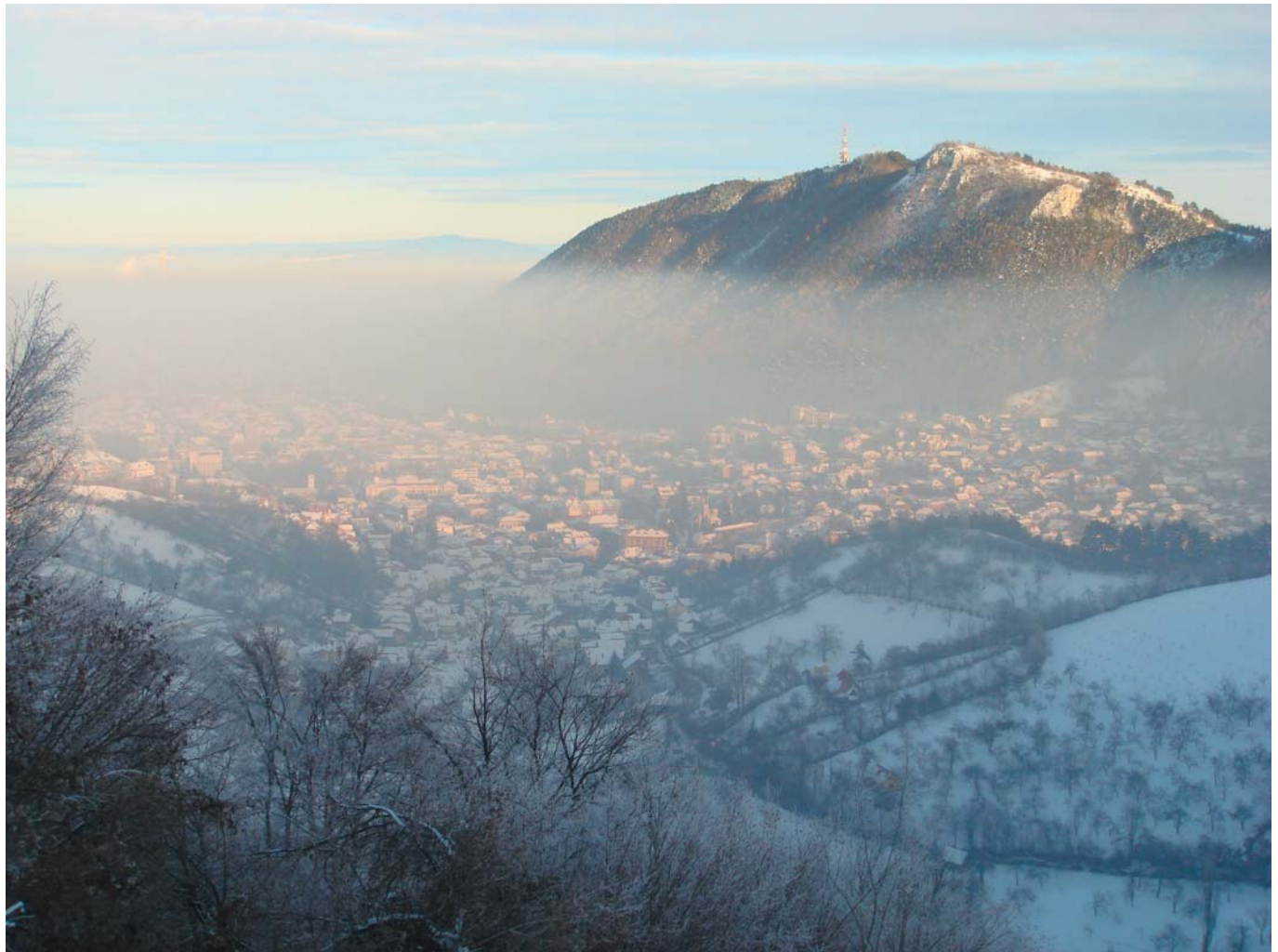
3 Вид на сказочную гору. Пояна-Брашов, Румыния, 2008