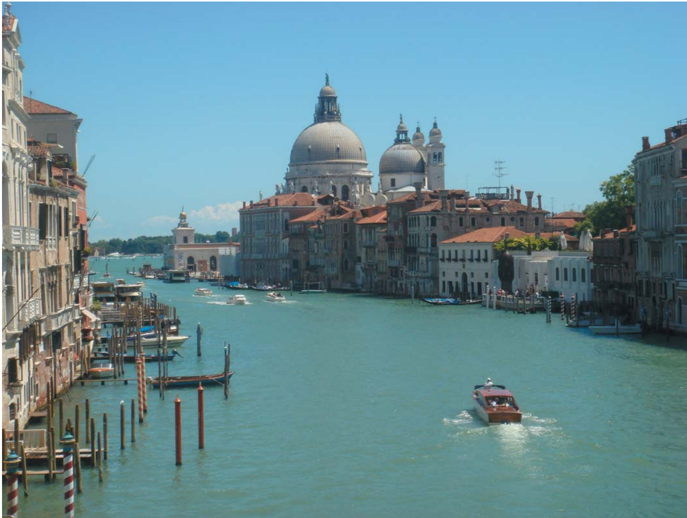
16 Гранд-канал. Венеция, Италия, 2009