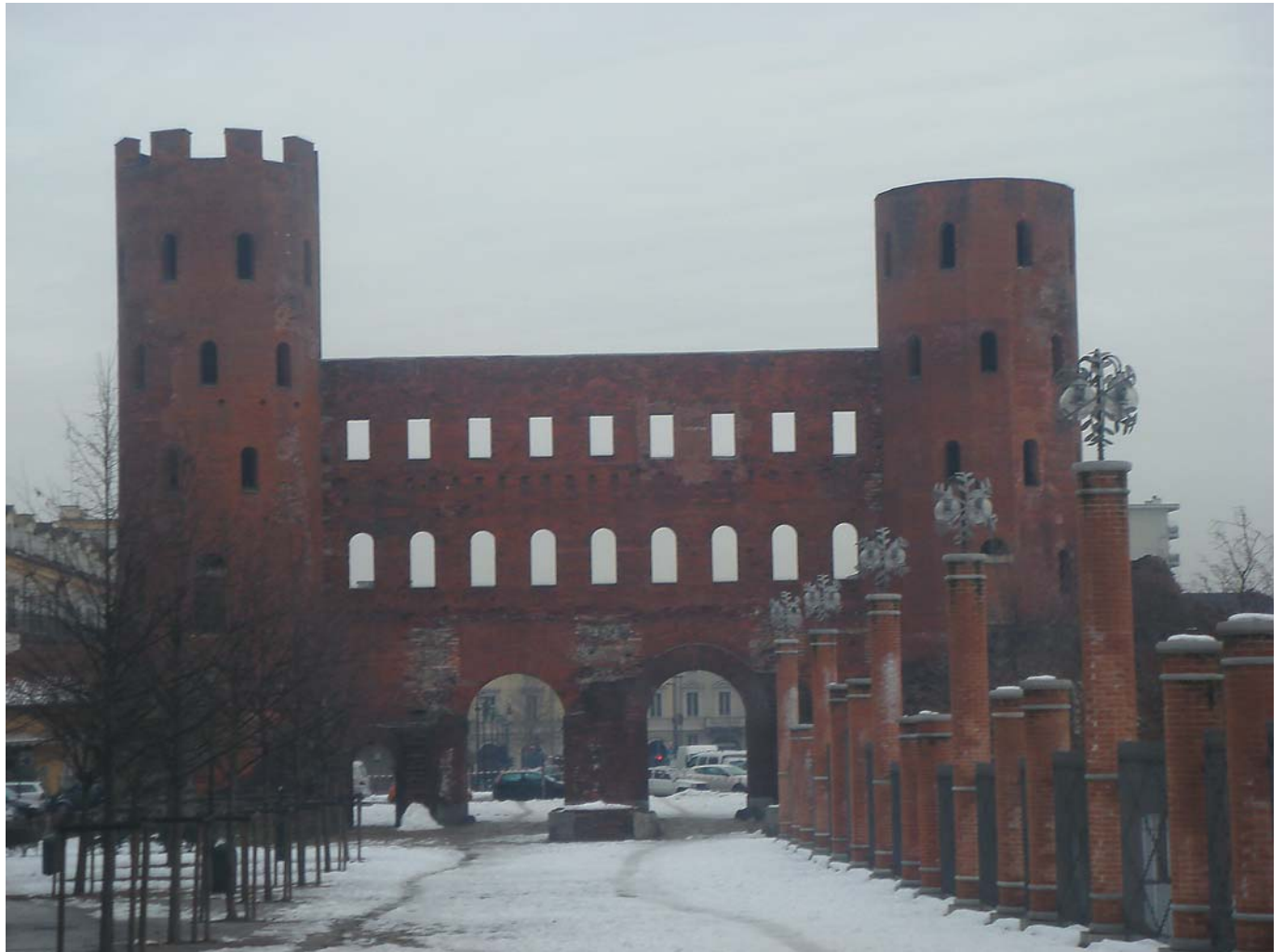
9 Завораживающие Палатинские ворота, 1 век н. э. Турин, Италия, 2009