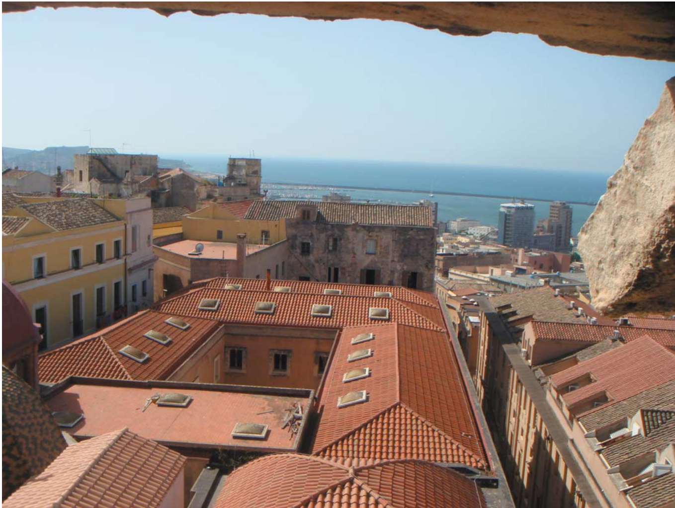
24 Сквозь бойницы башни Сан-Панкрацио. Кальяри, остров Сардиния, Италия, 2010