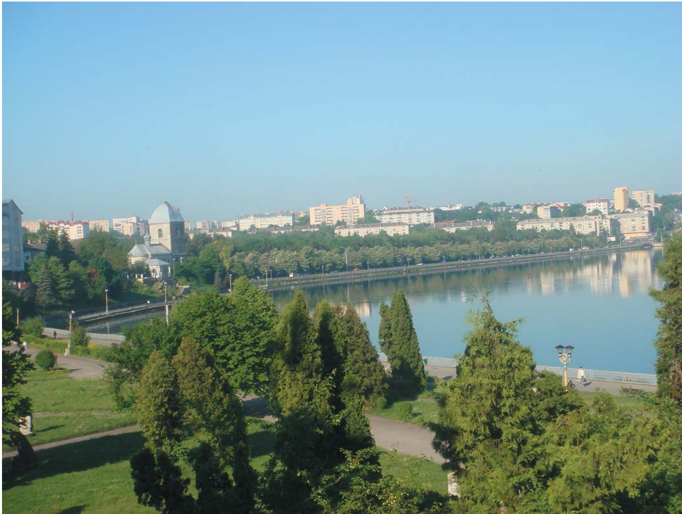
14 Удивительное городское озеро. Тернополь, Украина, 2009