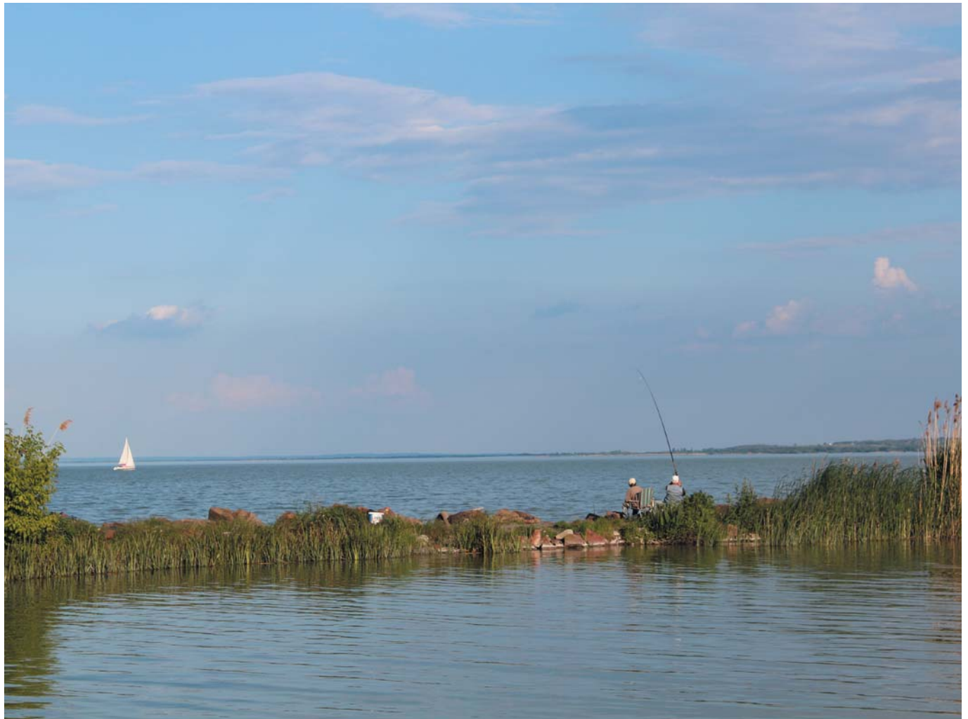
49 На озере Балатон. Кестхей, Венгрия, 2016