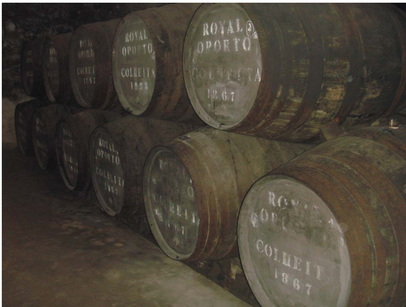
40 В галерее погребов у полторавекового вина... Порто, Португалия, 2013