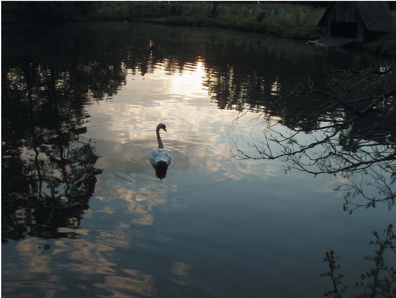
2 «А белый лебедь на пруду...» Трускавец, Украина, 2007