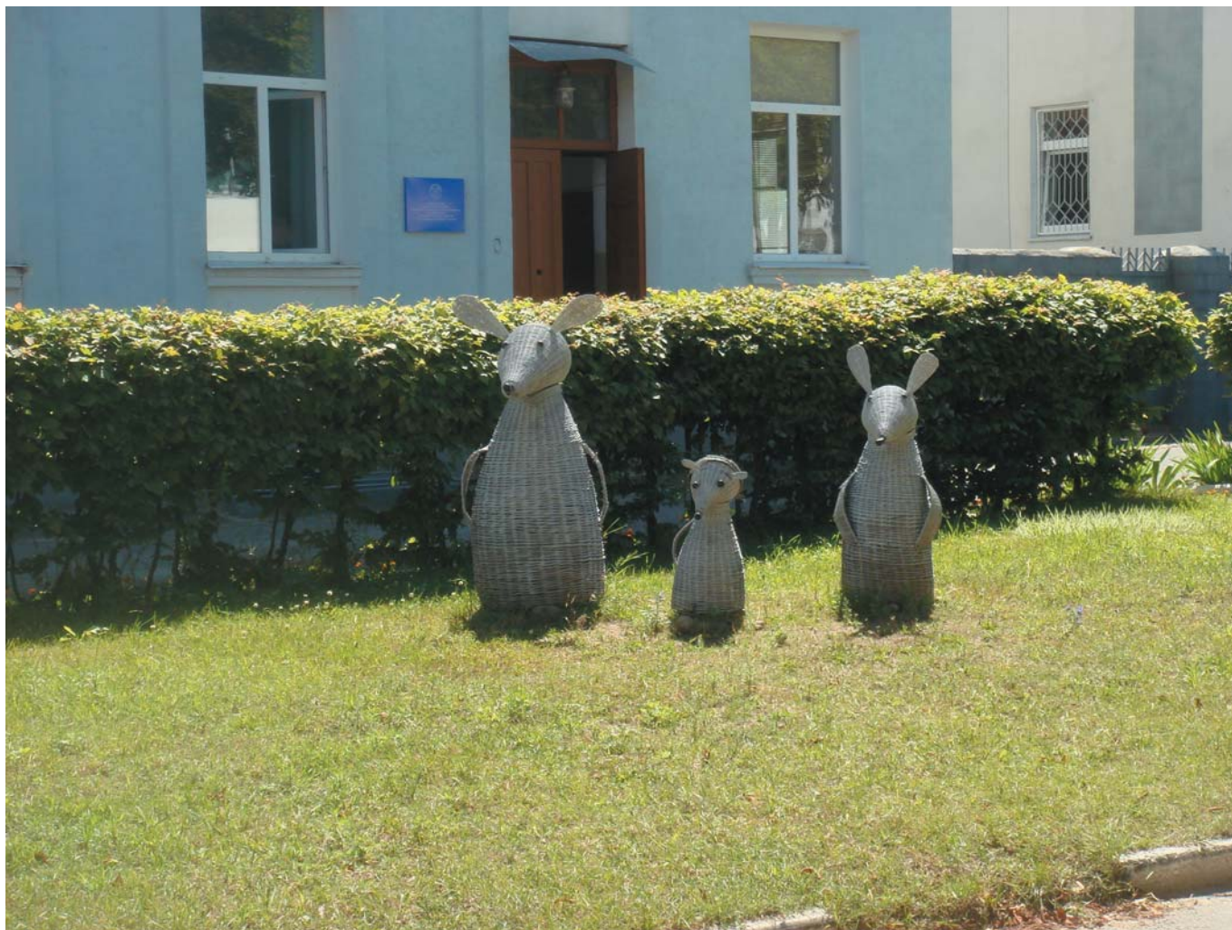
44 Серое семейство. Мозырь, Беларусь, 2014