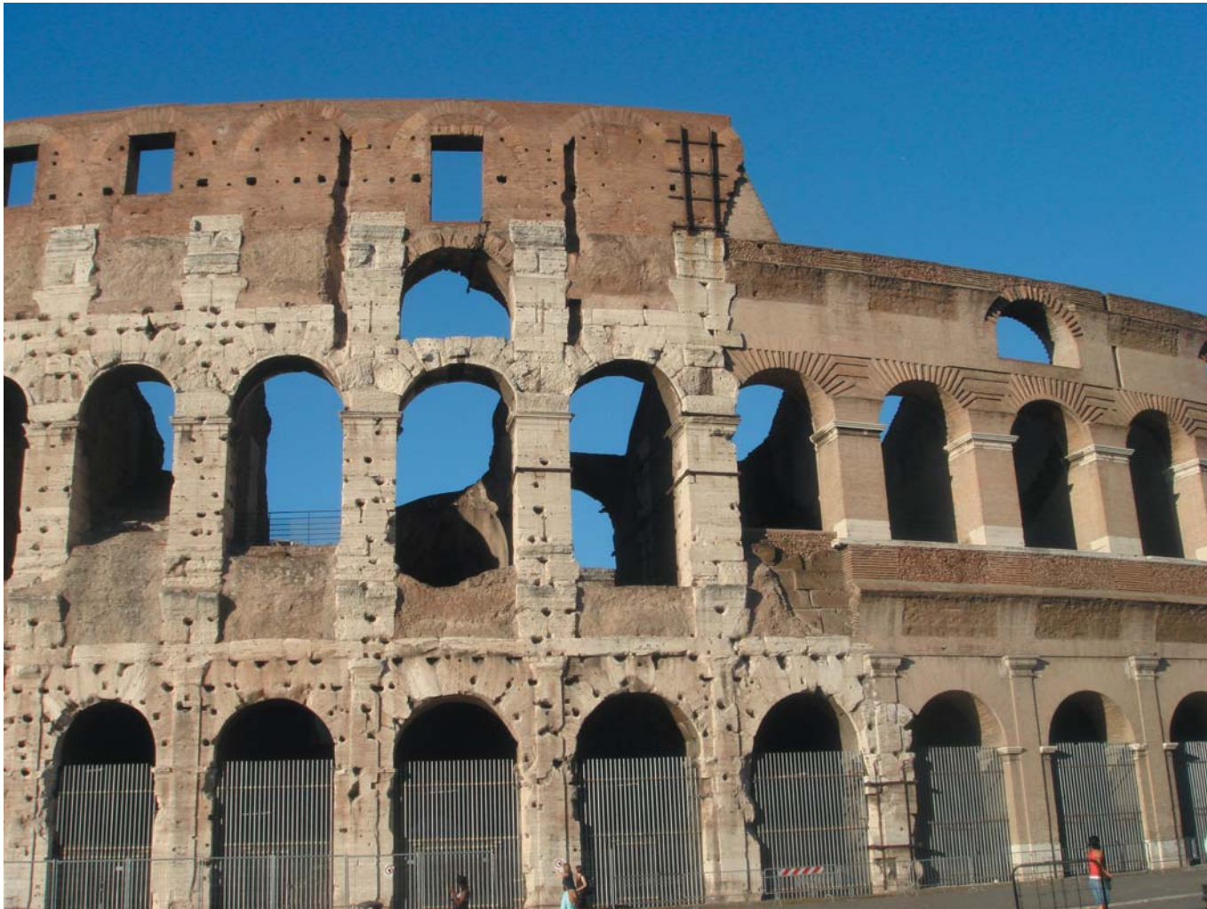
6 У стен древнего Колизея. Рим, Италия, 2008