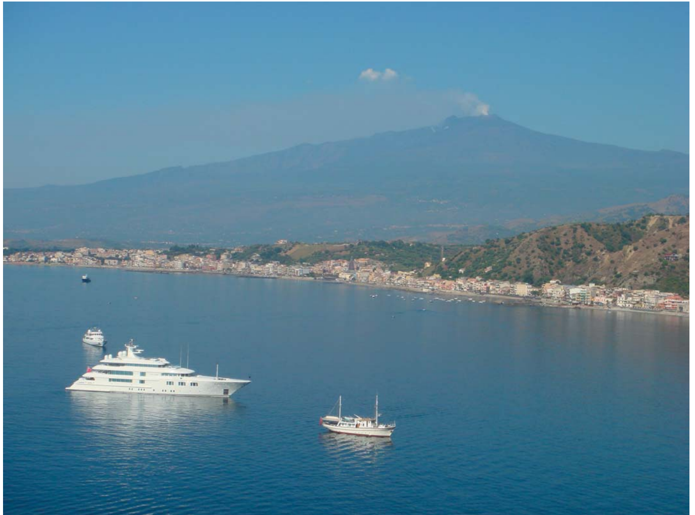
5 Сицилия, Ионическое море, вулкан Этна. Таормина, Италия, 2008