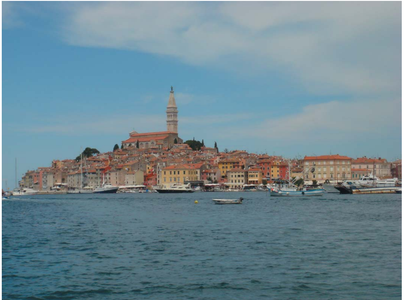
15 Старинный центр города Ровинь на полуострове. Хорватия, 2009