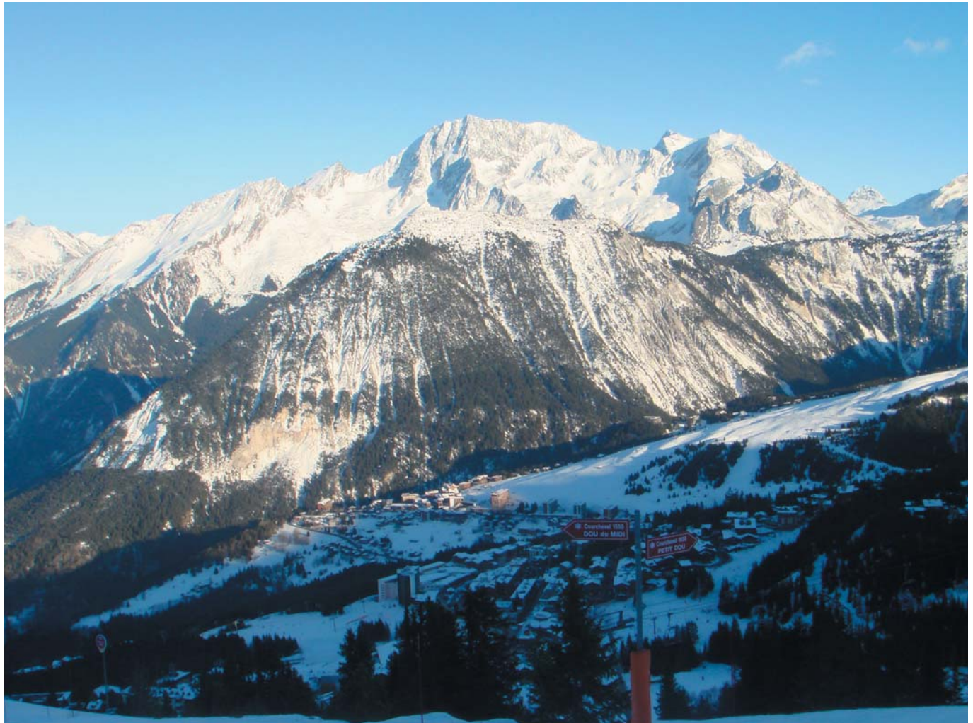
7 Французские Альпы. Куршавель, Франция, 2009