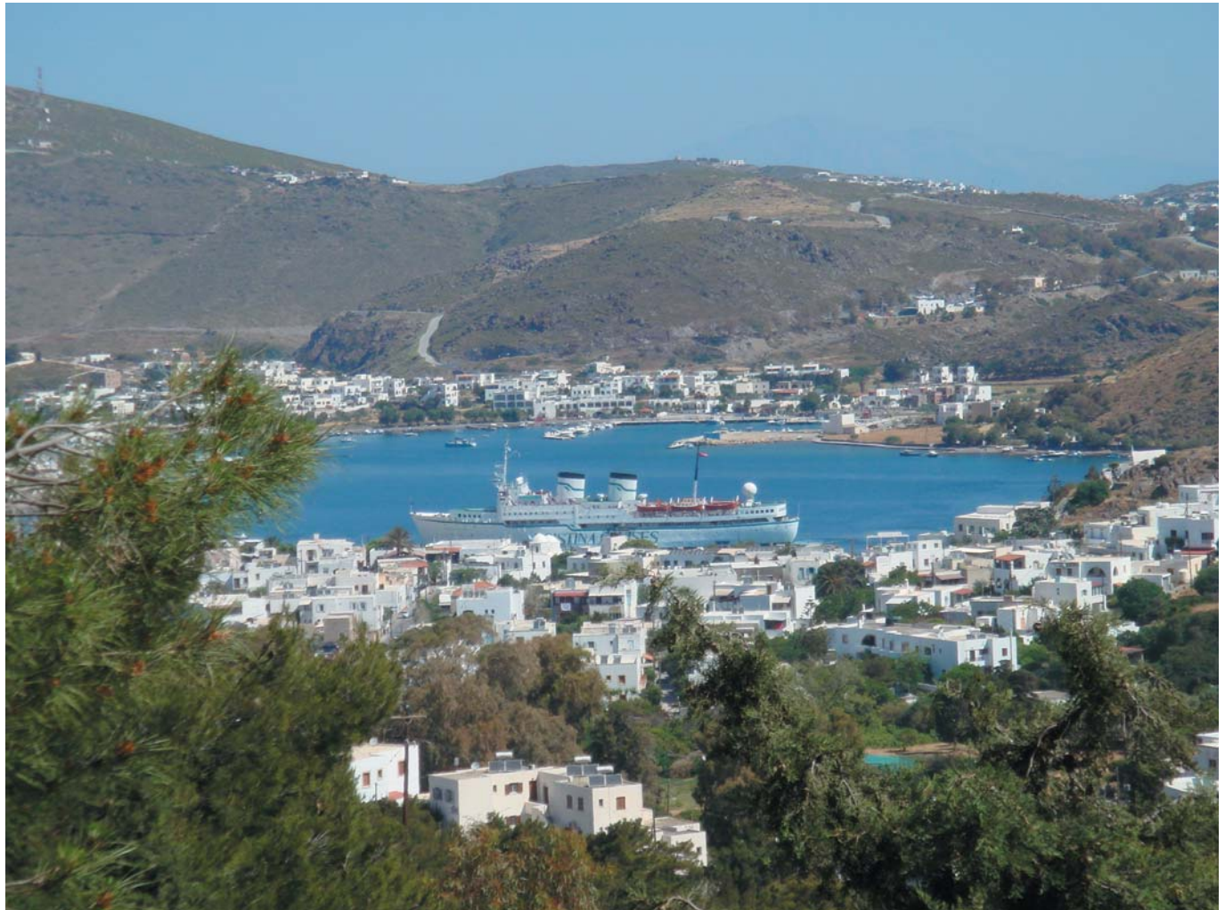
21 Чарующий залив Патмос. Остров Патмос, Греция, 2010