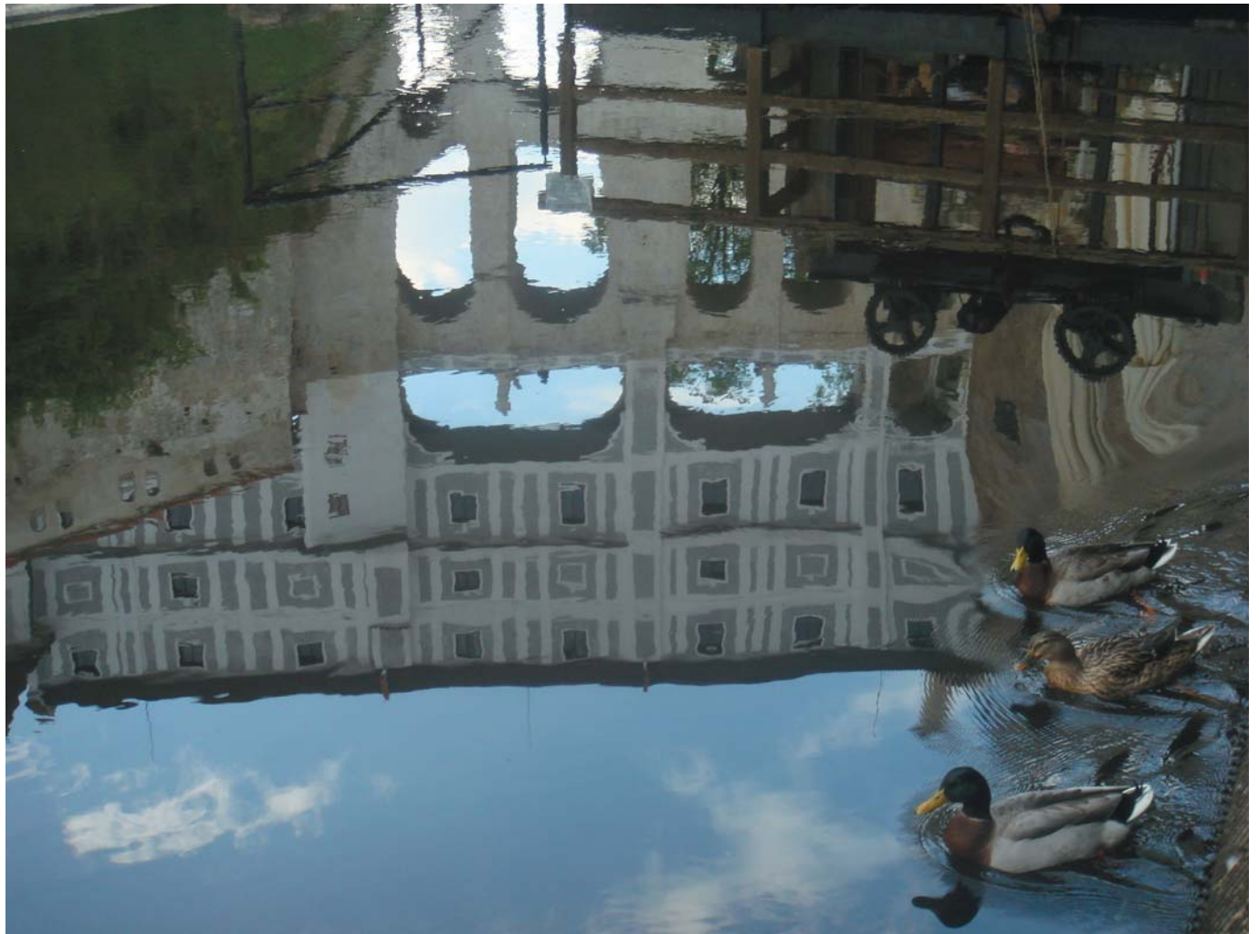
11 Утиное семейство возле Плащевского моста. Чески-Крумлов, Чехия, 2009