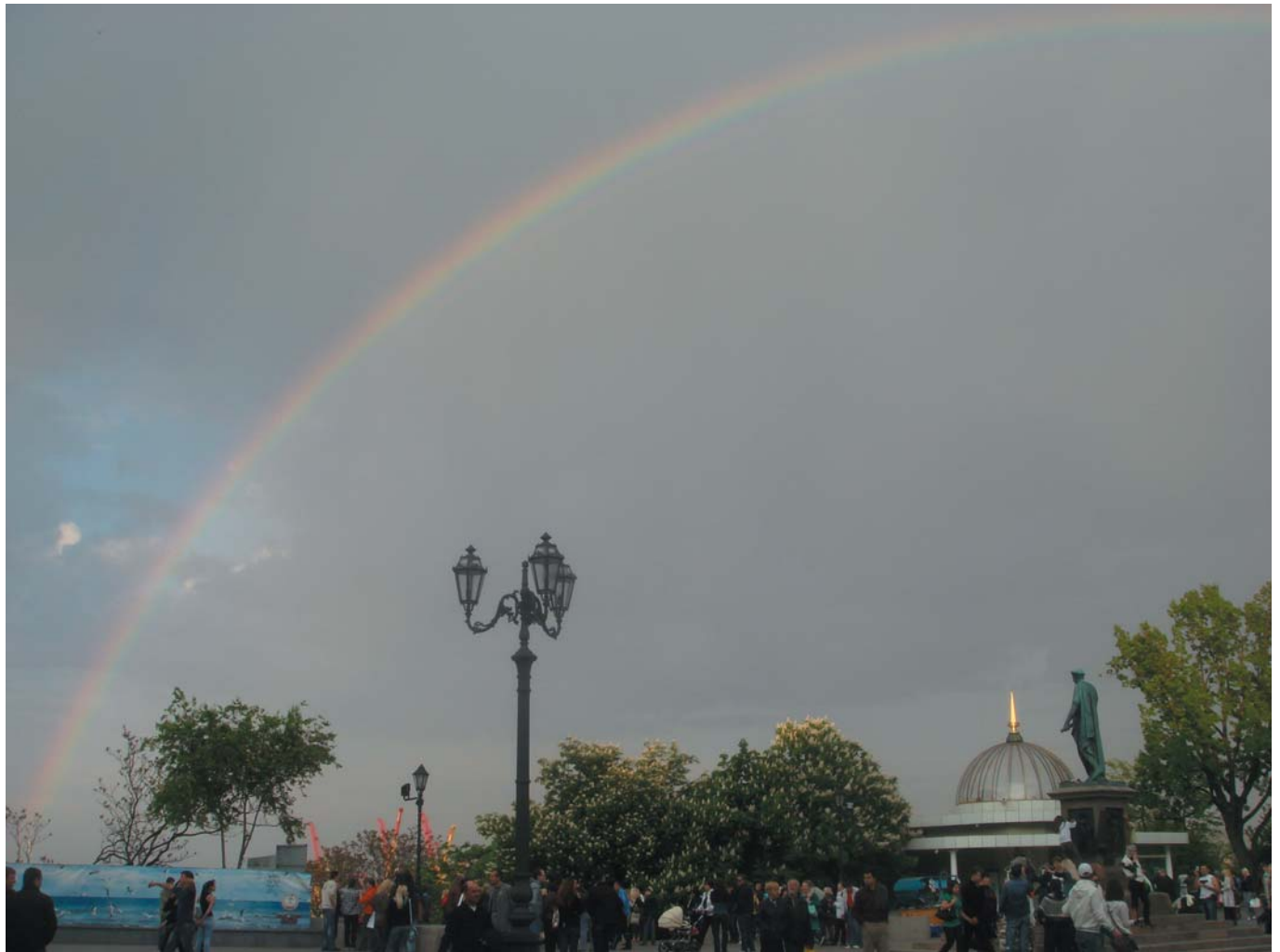
13 Приморский бульвар. Одесса, Украина, 2009