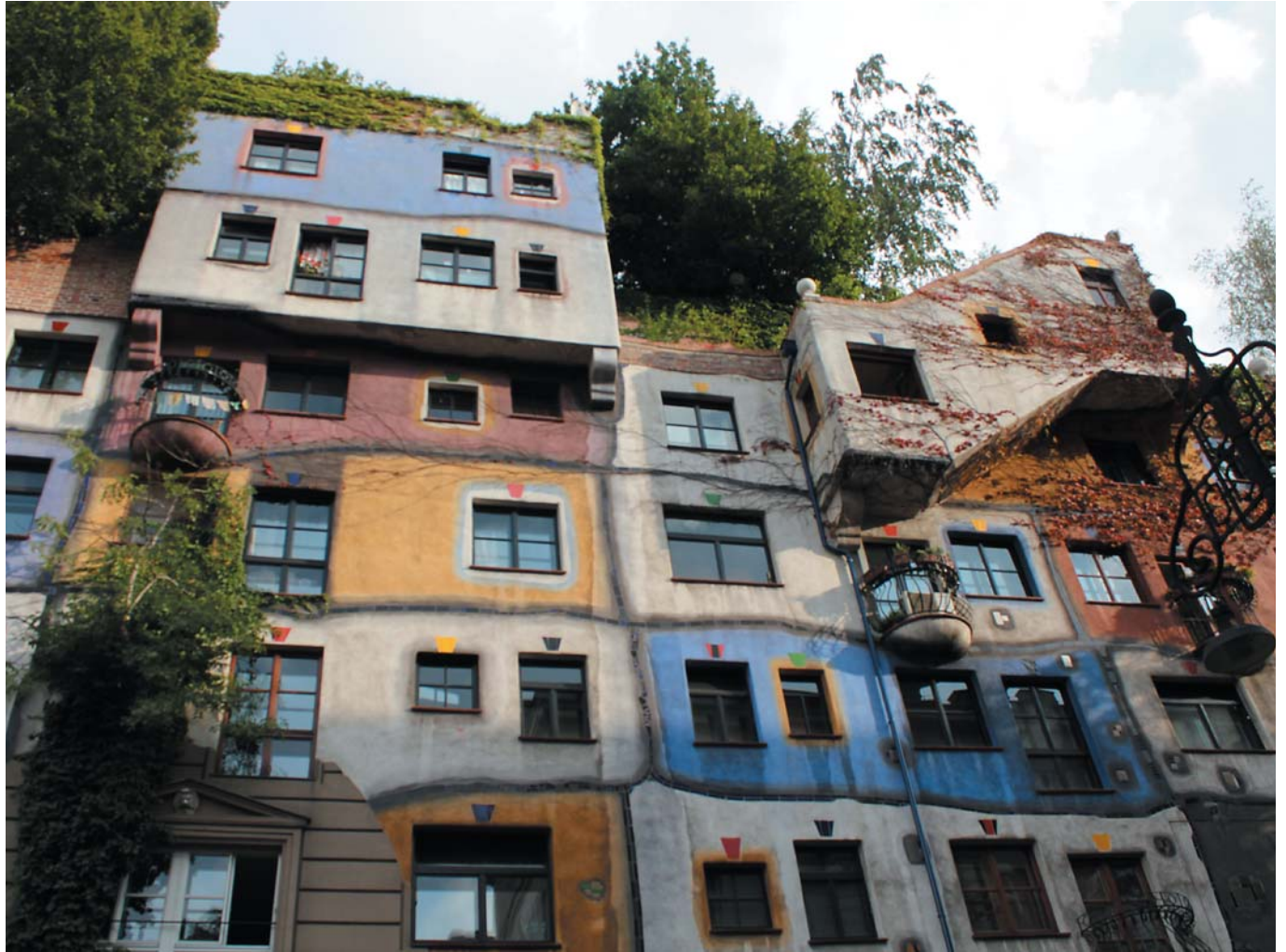
39 Дом Хундертвассера. Вена, Австрия, 2012