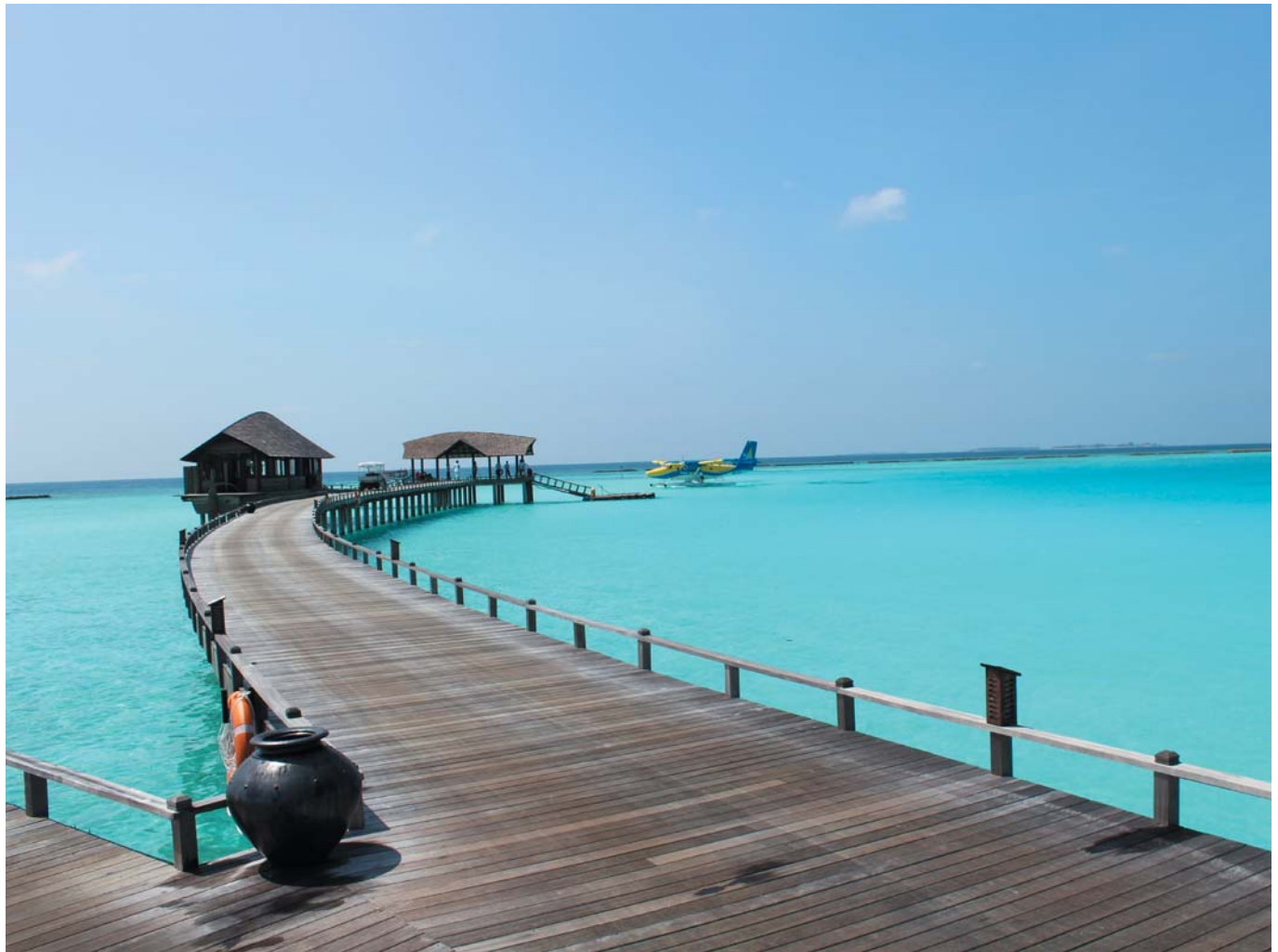
37 Прибрежная лазурь. Остров Иру Фуши, Мальдивы, 2012