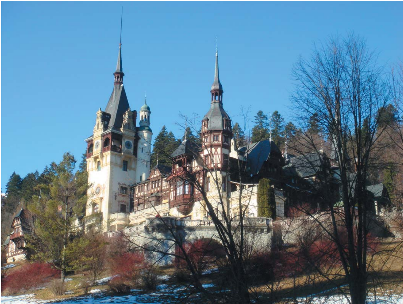
4 Старинный замок. Трансильвания, Румыния, 2008