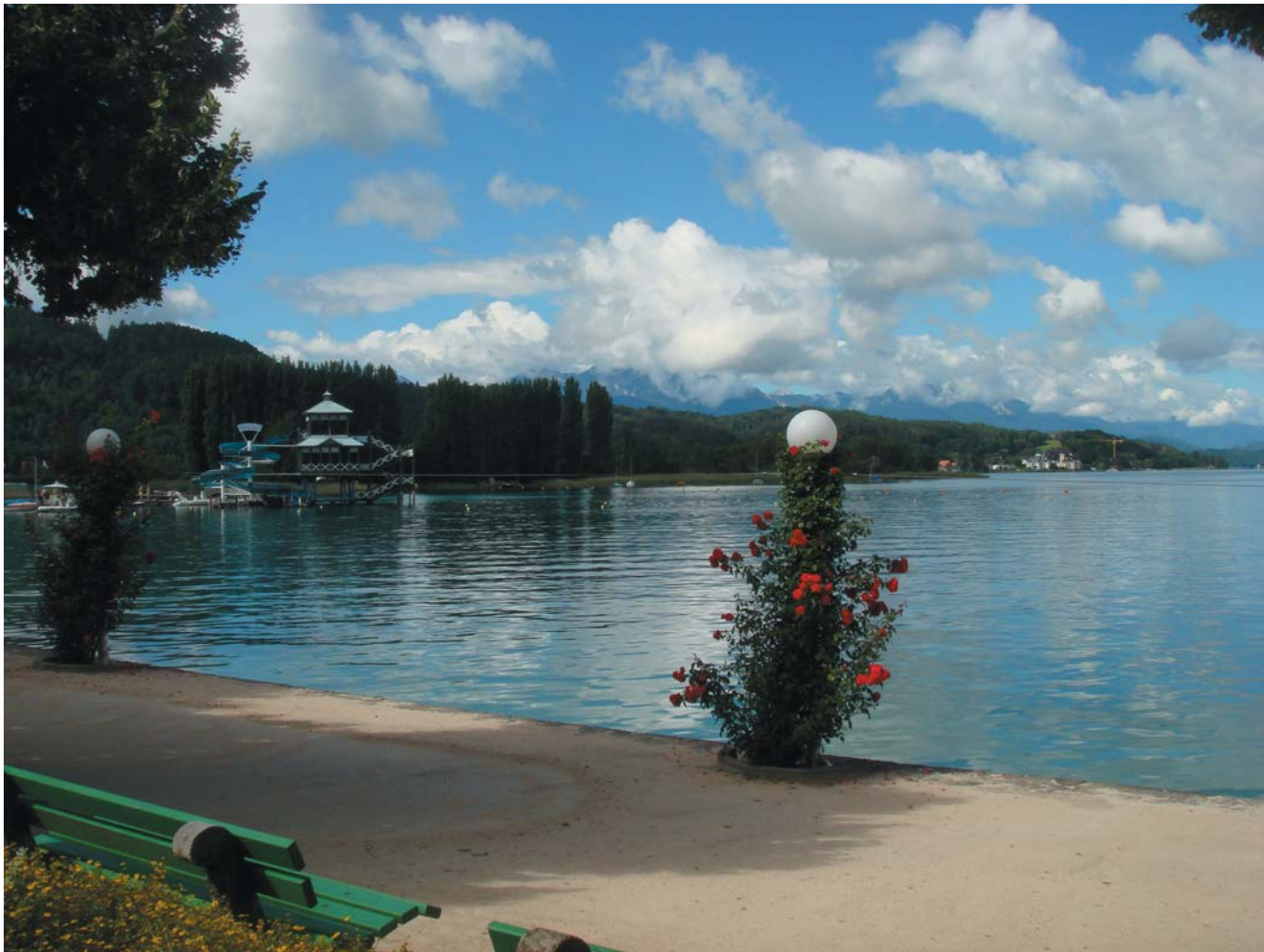
38 На берегу озера Вёртер-Зе. Клагенфурт, Австрия, 2012