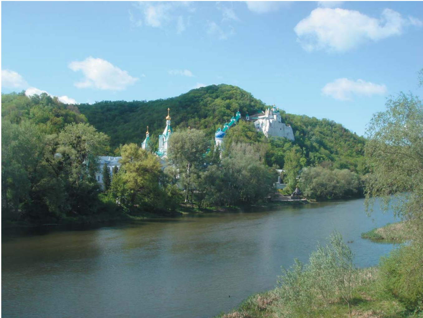
22 Вид на Свято-Успенскую Святогорскую Лавру. Святогорск, Украина, 2010