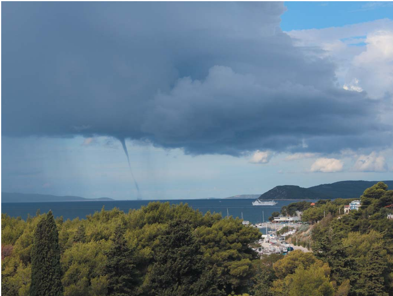
36 Водяной тромб на Средиземноморье. Сплит, Хорватия, 2011