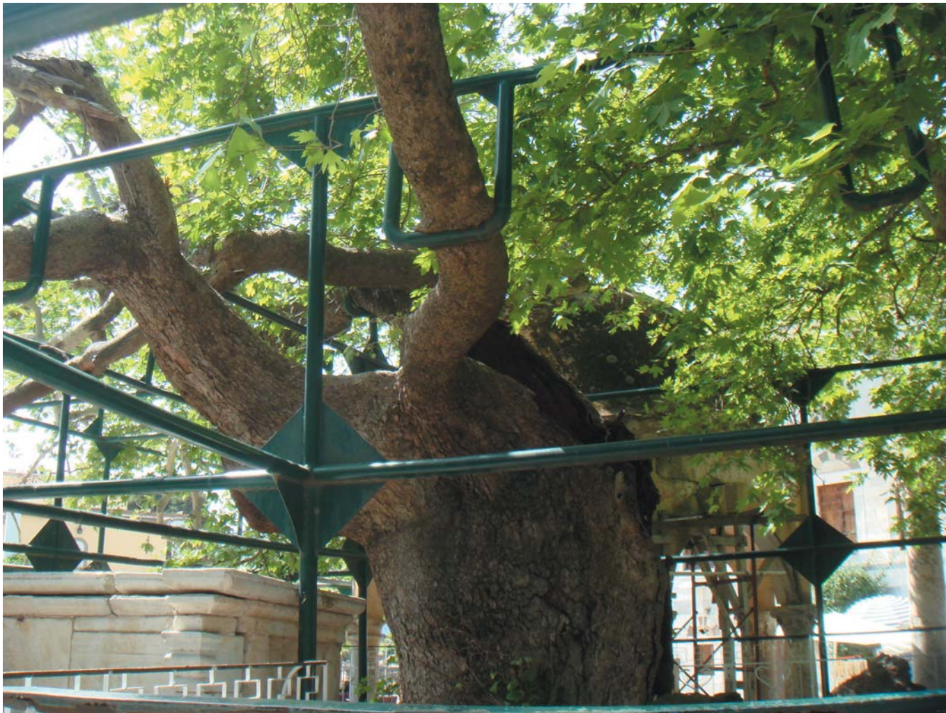
20 Платан Гиппократа. Остров Кос, Греция, 2010