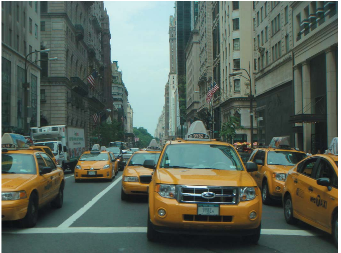
33 Желтая армия. Манхеттен, США, 2011