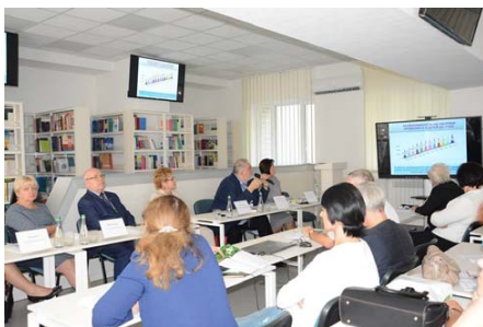
Сідельниківські читання – 2018, засідання секції

Такі зміни відбуваються й в Науковій бібліотеці Харківського національного медичного університету (НБ ХНМУ). Пройшовши певний шлях у вирішенні питань трансформації бібліотечного простору, в 2018 році в університеті відкрито оновлений інформаційно-бібліотечний комплекс – сучасний центр з новітнім технічним обладнанням, можливістю вільної трансформації розстановки меблів за потребою, комфортними умовами, включаючи зону коворкінгу – все необхідне для індивідуальної та групової роботи, проведення освітніх та наукових заходів, організації інтелектуального дозвілля [4].