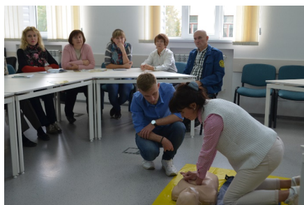
Майстер-клас з надання першої домедичної допомоги

Найближчим часом відбудуться літературно-музичні вечорниці, зустрічі English Speaking Club тощо. Треба зазначити, що Науковій бібліотеці ХНМУ ніколи не бракувало уваги користувачів, але після відкриття оновленого простору її популярність зростає ще більше. В бібліотеці створено журнал резервування приміщень для проведення різноманітних заходів, вже заплановані заходи до кінця року. І що головне – ініціаторами більшості заходів є користувачі, які місцем своїх активностей обрали саме університетську бібліотеку. А вона у свою чергу виконує важливу місію – сприяє формуванню соціально активної, естетично розвиненої особистості, розвитку ініціативної діяльності молоді, виявленню та підтримці талановитих людей і певних компетенцій.