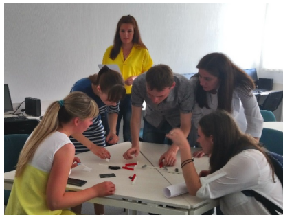
Квест з підготовки студентів до іспиту Крок 1