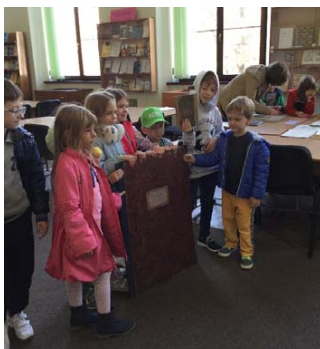
Фото 2. «...формати бувають різні!»