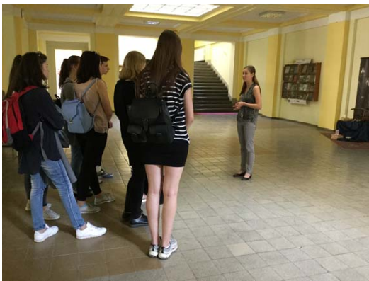
Фото 3. Експерсія для студентів І курсу ЛНУ ім. І. Франка