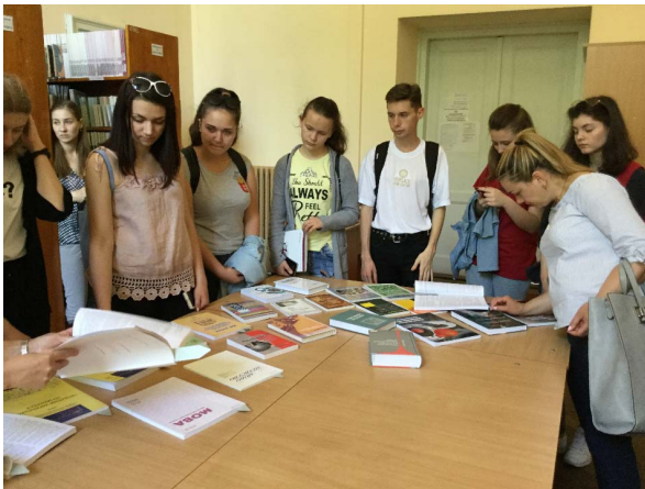
Фото 5. Знайомство з фондом НТБ (експрес-виставка для студентів ІКТА, гр. ПЛ)