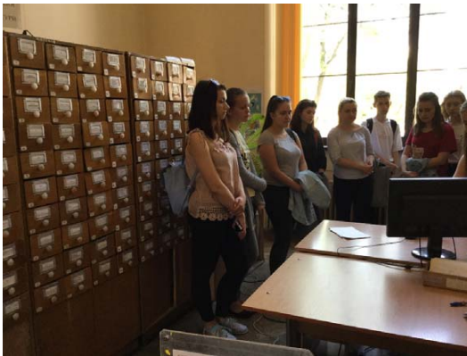
Фото 4. В каталожному залі (експерсія для студентів ІКТА, гр. ПЛ)