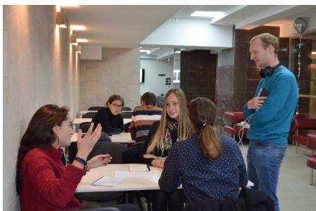
Тренувальні ігри клубу «Що? Де? Коли?»

З перших днів роботи оновленого комплексу стало зрозуміло – для користувачів, зокрема студентів, створено саме такі умови, які приваблюють, сприяють розвитку їх ініціативної діяльності. Так, за перший місяць нового навчального року майже щодня в бібліотеці проходили засідання різноманітних секторів Студентської ради ХНМУ, тренувальні ігри студентської команди інтелектуального клубу «Що? Де? Коли?», майстер-класи з надання першої домедичної допомоги, засідання секцій наукових конференцій, виставка малюнків дітей-пацієнтів та багато інших заходів.