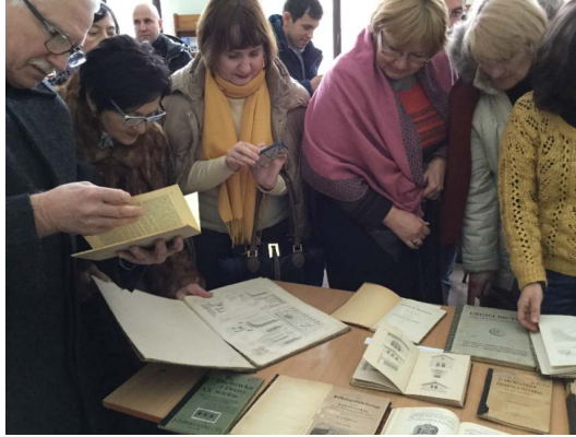
Фото 6. Виставка цінних та рідкісних видань на заході «Історія цегельного бізнесу»