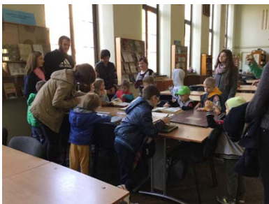
Фото 1. Екскурсія для школярів Альтернативної Хеппі-Школи

Впродовж останніх років, працівники відділу беруть участь в екскурсійній роботі , як одному з напрямків діяльності бібліотеки з формування інформаційної культури серед студентів. З ініціативою проведення таких заходів до нас звернулися куратори та викладачі таких інститутів, як ІГДГ (кафедра геодезії та астрономії), ПМТ (кафедра транспортних технологій), ІХХТ (кафедра хімії і технологій неорганічних речовин), ІКНІ (кафедра прикладної лінгвістики). Крім того, екскурсії проводилися як для студентів інших вузів (ЛНУ імені І. Франка), так і для школярів львівських шкіл та колег з інших бібліотек. Під час кожної екскурсії відвідувачі знайомляться з історією бібліотеки, її розвитком та сучасними напрямками роботи книгозбірні, послугами та електронними сервісами. За бажанням відвідувачів, працівники відділу готують експрес-виставки та огляди видань.