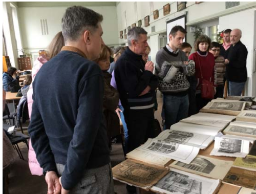
Фото 7. Виставка цінних та рідкісних видань на заході «Ар Деко у Львові»