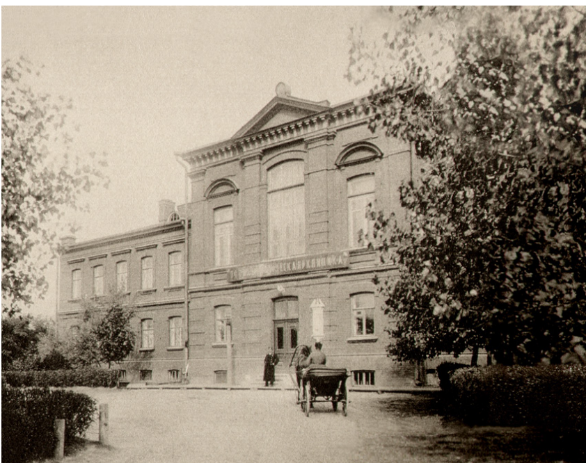
Офтальмологическая клиника в Харькове. Начало XX века

Во время поездки Н. И. Пирогова интересовало все: и успехи берегательного лечения, и помощь раненым на поле сражения, и деятельность Красного Креста и военно-медицинской администрации. С чувством гордости за отечественную науку он отмечал, что все зарубежные врачи широко применяли его методы лечения и предложенную им организацию медицинской помощи раненым и больным. «Отчет...»