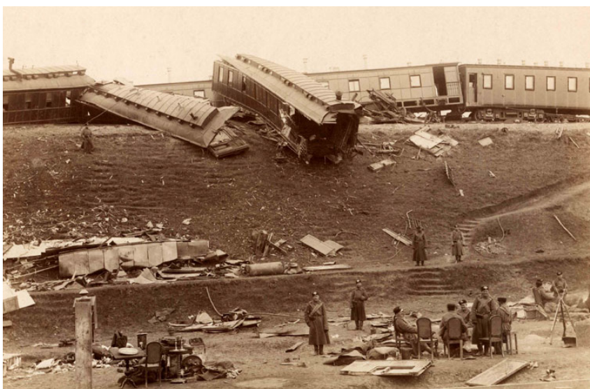
Крушение поезда близ станции Борки. 1888 год

В 1914 г. в городе организован Дамский комитет, открывавший лазареты для раненых, приюты для детей. Об этом мы узнаем из книги «Годовой отчетъ (по 1-е