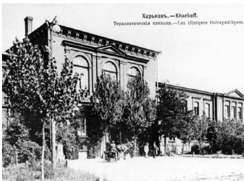
Терапевтическая клиника в Харькове. Начало XX века

К концу 60-х годов XIX века численность медицинских обществ в России составляла 27, а к началу 80-х годов их существовало уже более 40. Эти общества оказывали материальную помощь