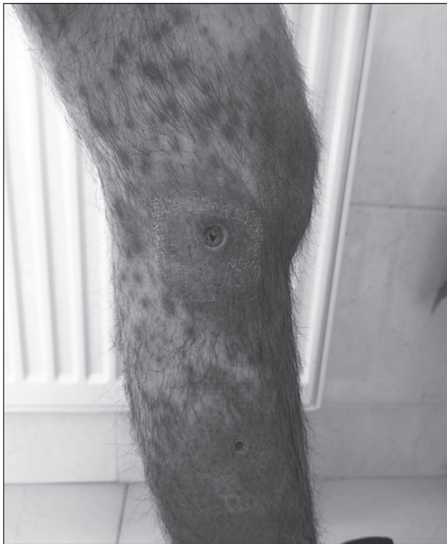
Рисунок 1. Шкіра хворого навколо рани при госпіталізації до лікарні

іншої етіології та без адекватного лікування можуть закінчитися летальним результатом. За даними деяких авторів, рівень летальності при стрептококовому сепсисі дорівнює майже 30 %.