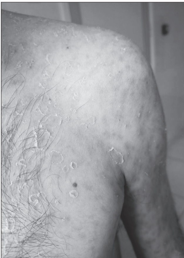
Рисунок 4. Пластинчасте лущення епідермісу на тулубі пацієнта

Експрес-тести від 06.03.2023 р. на ВІЛ-інфекцію, вірусні гепатити В і С — негативні.