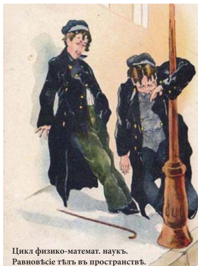
Цикль физико-математ. наукъ. Равновѣсіе тѣлъ въ пространствѣ.