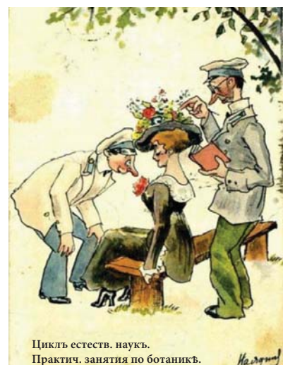
Цикль естеств. наукъ. Практич. занятія по ботаникѣ.

«Медицинский университет» Реєстр. свідоцтво ХК № 2098 – 839 ПР від 05.03.2014 р. Засновник – Колектив Харківського національного медичного університету. Газета виходить один раз на місяць Адреса редакції: 61022, Харків, пр. Леніна, 4. Гол. корпус, 5 поверх, тел. 707-73-60 e-mail: redakt@knmu.kharkov.ua www.knmu.kharkov.ua