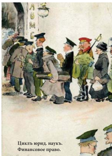
Цикль юрид. наукъ. Финансовое право.