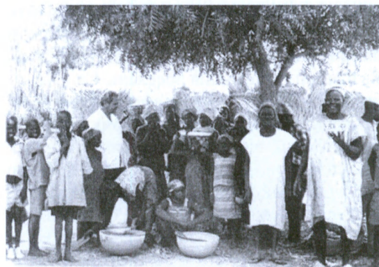
І.Д. Ладний серед місцевого населення. Нігерія, квітень 1976 року

І.Д. Ладний працював у складі інтернаціонального дивізіону по боротьбі з натуральною віспою у найбільш віддалених і неблагополучних державах Африки. Під його опікою були 22 країни, і за чотири роки вся зона його відповідальності – Східна, Центральна і Південна Африка – стала вільна від віспи [9]. В більшості країн Африканського регіону не були розвинені інфраструктура і система охорони здоров'я. Але, незважаючи на все це, Іван Данилович працював самовіддано, не відчуваючи страху. Він оцінював ситуацію у відповідній країні, традиції та звичаї населення, можливості для подолання епідемії за конкретних умов, робив певні висновки та давав рекомендації уряду кожної з цих країн і ВООЗ з оптимізації та впровадження найбільш ефективних заходів щодо запобігання випадків натуральної віспи [3, 9]. Іван Данилович був людиною, яка не тільки пропонувала ефективні протиепідемічні, профілактичні та організаційні заходи для успішного досягнення цілей, а й особисто брав активну участь в організації виконання амбітної програми подолання натуральної віспи. Для цього він постійно