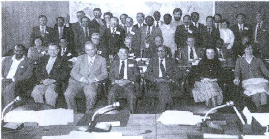
Члени глобальної комісії із засвідчення ліквідації віспи і співробітники штаб-квартири ВООЗ після підписання заключення про повсюдну ліквідацію віспи, 9 грудня 1979 р., Женева

підтримка ВООЗ цим країнам була вельми обмежена, він домогся такого рівня інтенсивності заходів, що через чотири роки весь регіон від віспи звільнився. Я благав доктора Венедиктова знайти можливість продовження контракту доктора Ладного ще на кілька років. Він намагався, але безуспішно. Доктор Венедиктов порадив, щоб я написав переконливий рекомендаційний лист, а він постарався б через рік відновити цей контракт з ВООЗ. Такий лист я направив, але, на свій подив, дізнався, що доктор Ладний вже призначений на відповідальну посаду в Москві і тому у ВООЗ відряджений бути не може. На своєму посту в Москві він пробув недовго, до моменту, коли Гендиректор ВООЗ д-р Халфдан Малер звернувся до уряду СРСР з проханням повернути його в ВООЗ як свого помічника. Незабаром д-р Ладний з'явився в Женеві, але вже як мій бос. Ми з ним продовжували плідно взаємодіяти, однак через короткий проміжок часу вже я покинув Женеву у зв'язку з затвердженням мене на посаді декана Школи громадської охорони здоров'я Університету Джона Хопкінса. Ладний став одним зі співавторів фундаментальної історії ліквідації натуральної віспи. Сумно, що Іван так рано помер, оскільки він мав усі передумови до ще більших досягнень» [17].