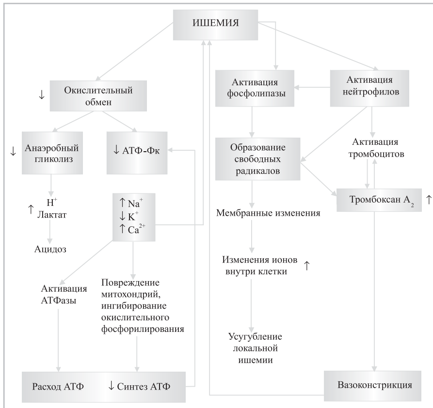
Рис. 1. Влияние ишемии на метаболизм кардиомиоцита (адаптировано из [6])

[7]. Ацидоз и АМФ активируют киназу, тормозящую ацетил-КоА-карбоксилазу, что приводит к уменьшению образования малонил-КоА и, следовательно, к повышению активности карнитинпальмитилтрансферазы-1 (КПТ-1). По этой причине митохондрии начинают поглощать большое количество жирных кислот, в результате чего образуется большое количество ацетил-КоА и НАДН, увеличивается отношение ацетил-КоА/КоА и НАДН/НАД + , что резко тормозит пируватдегидрогеназу и разобщает гликолиз от окисления пирувата. Следовательно, при ишемии происходит «переключение» метаболизма кардиомиоцита на использование преимущественно жирных кислот в ущерб окислению других субстратов (глюкозы).