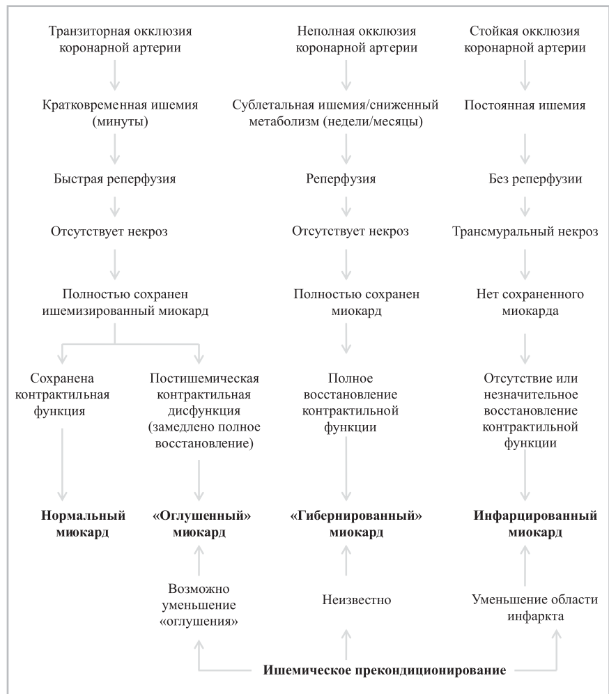
Рис. 3. Последствия ишемии. «Оглушение» миокарда обычно наблюдается после транзиторной окклюзии коронарной артерии с последующей быстрой реперфузией, а также происходит при длительной ишемии в условиях прекондиционирования. Прекондиционирование может уменьшить область инфаркта во время стойкой окклюзии коронарной артерии; кроме того, взаимосвязь между прекондиционированием и поврежденным миокардом неизвестна (адаптировано из [11])

Изменения метаболизма кардиомиоцитов при ишемии могут рассматриваться как точка приложения медикаментозного воздействия, в частности, с помощью препаратов, способных прямо воздействовать на процессы, протекающие в митохондриях [9]. В течение нескольких последних десятилетий в медицине интенсивно развивается так называемое «метаболическое» направление, ставящее своей целью теоретический и прикладной анализ нарушений клеточных обменных процессов при сердечно-сосудистой патологии. К настоящему моменту создан целый ряд антиангинальных препаратов, прямо воздействующих на метаболические процессы в кардиомиоцитах, получивших название «миокардиальные цитопротекторы». К ним относятся парциальные ингибиторы \beta -окисления жирных кислот или р-FOX-ингибиторы (partial fatty and oxidation inhibitors), в частности триметазидин, ранолозин и мельдоний. Они способны обеспечить замедление скорости \beta -окисления жирных кислот в митохондриях (триметазидин, мельдоний) и ограничить транспорт жирных кислот через клеточные мембраны (мельдоний). Данные препараты улучшают процессы окислительного фосфорилирования, что обуславливает снижение продукции свободных радикалов, нивелирует патогенные эффекты, свойственные ишемии и реперфузионному повреждению миокарда [16]. Одним из препаратов указанной группы является отечественный препарат мельдония Метамакс.