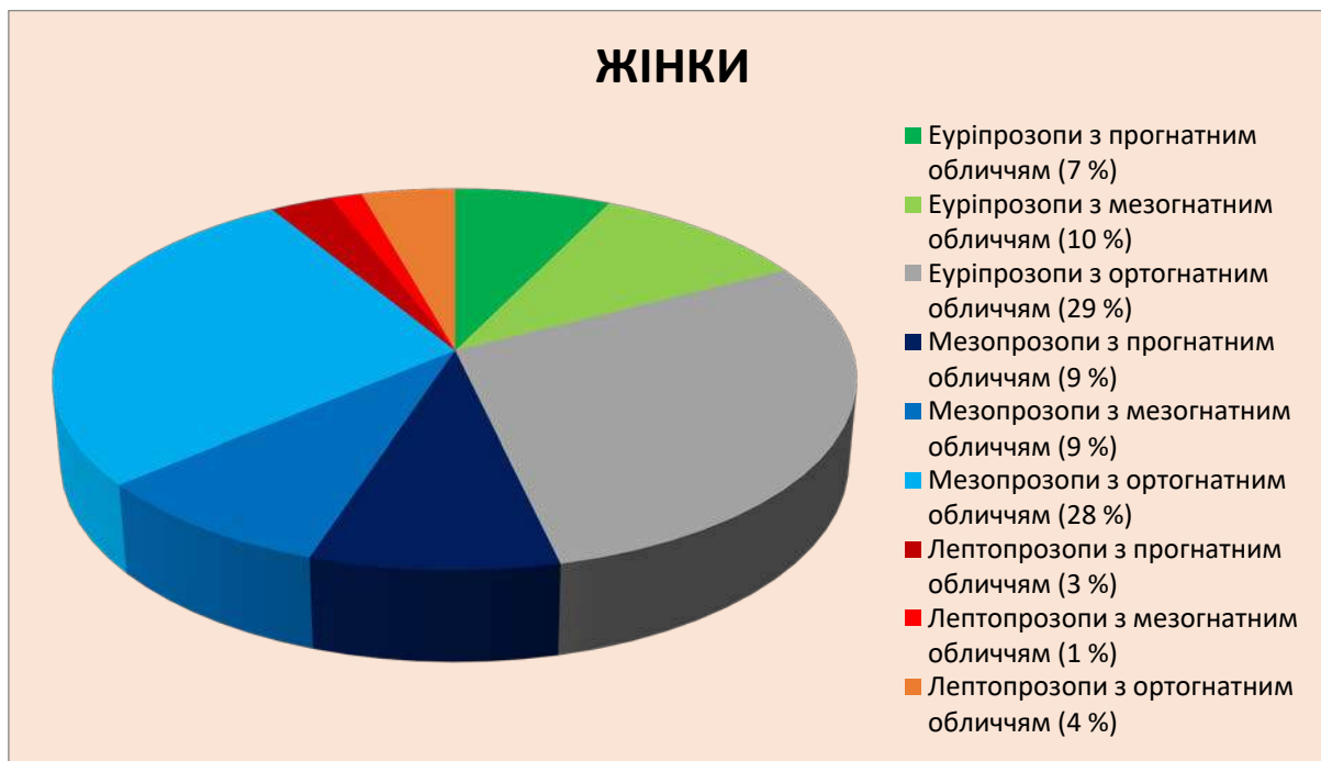
Рис. 3. Частота зустрічальності різних форм профілю обличчя при різних краніотипах.

Середнє значення виличного кута у еуріпрозопів жінок становить 118,5^\circ при \sigma = 6,40 (діапазон коливань – 101^\circ - 128^\circ ), у мезопрозопів – 119,8^\circ при \sigma = 4,04 (знаходиться в межах від 114^\circ до 128^\circ ), у лептопрозопів – 112,7^\circ при \sigma = 3,95 (при діапазоні – 96^\circ - 120^\circ ). На рівні отриманих середніх значень дослідженого кута було зафіксовано їх достовірну різницю залежно від статі, а саме збільшення у еуріпрозопів та зменшення у лептопрозопів чоловіків у порівнянні з жінками.