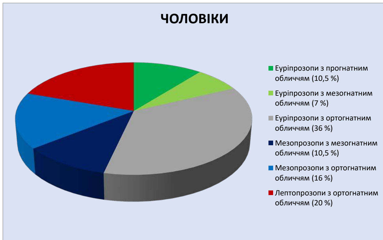
Рис. 2. Частота зустрічальності різних форм профілю обличчя при різних краніотипах.

Значення виличного кута еуріпрозопів визначається в діапазоні від 113^{\circ} до 130^{\circ} (при середньоарифметичному – 122,1^{\circ} \pm 5,47 ). У мезопрозопів цей показник демонстрував діапазон коливань від 113^{\circ} до 125^{\circ} (середнє значення – 118,9^{\circ} \pm 4,33 ). Виличний кут лептопрозопів показав найменші значення. Він знаходився в межах від 95^{\circ} до 109^{\circ} (при середньоарифметичному – 101,5^{\circ} \pm 4,76 ). Встановлено, що середні значення виличного кута еуріпрозопів і мезопрозопів достовірно відрізнялися між собою та від аналогічного показника лептопрозопів.