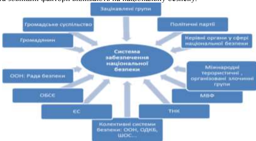
Рис. 2. Зовнішні та внутрішні суб'єкти забезпечення національної безпеки

Стосовно питання про міжнародні конфлікти варто відзначити їхню значущість для України та інших країн світу. Окреслити міжнародну взаємодію у питаннях національної безпеки, вивчити передовий вітчизняний та міжнародний досвід у цьому напрямку. Важливо розуміти, які внутрішні та зовнішні фактори впливають на національну безпеку.