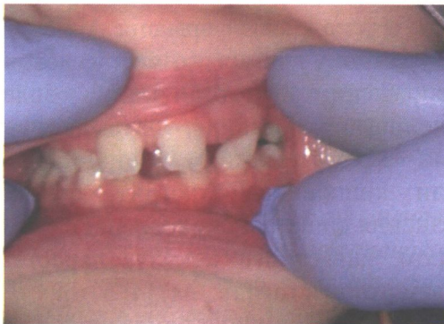
Рис.1. Фото вестибулярної поверхні зубів 1.1, 1.2, 5.3, 6.3.

При огляді порожнини рота: на нижній щелепі відзначається первинна адентія центральних постійних різців (рис.3, рис.4). Порожнина рота раніше санована: в зубі 4.6 на жувальній поверхні є пломба, а в зубі 3.6 нами проведена неінвазивна герметизація фісур.