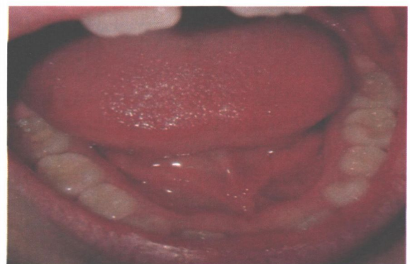
Рис.4. Нижня щелепа, жувальна поверхня тимчасових та постійних зубів (в зубі 3.6 проведено неінвазивну герметизацію фісур, в зубі 4.6 – наявність пломби).