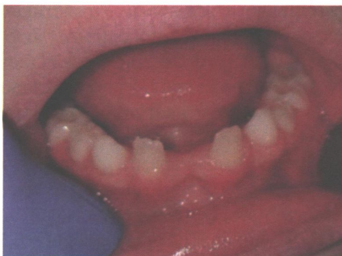
Рис.3. Фронтальна ділянка нижньої щелепи, відсутні центральні постійні різці. Первинна адентія зубів 3.1 та 4.1.