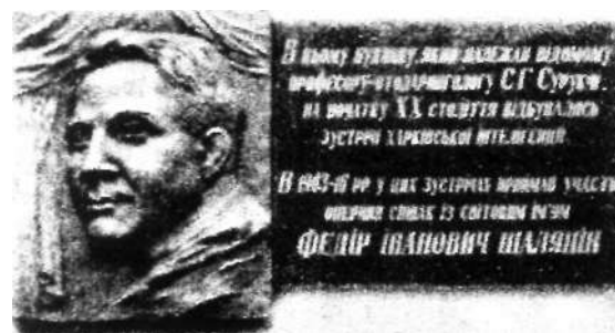
Мемориальная доска на доме С.Г. Сурукчи

В 1905 г. в Харькове давал концерты Ф.И. Шаляпин. Еще с 1903 г. у великого певца появились неполадки с голосом, как считали врачи, вследствие переутомления. Но отдых не принес существенного улучшения. Во время пребывания в Харькове врачи порекомендовали лучшего харьковского отоларинголога С.Г. Сурукчи. Вмешательство замечательного врача помогло устранить дисфонию. С этого времени у всемирно известного певца на многие годы установились теплые дружеские отношения с С.Г. Сурукчи и его семьей. При каждом посещении Харькова Ф.И. Шаляпин неизменно бывал в доме Сурукчи по ул. Садовой №5 (ныне ул. Чубаря).