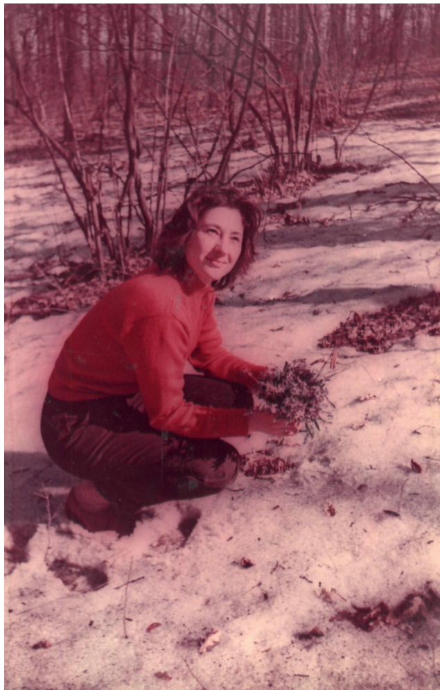
Первые весенние цветы (1964 г.).