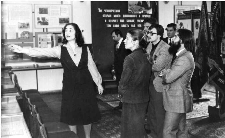
Экскурсия в Музее истории ХМИ для иностранной делегации (1977 г.).