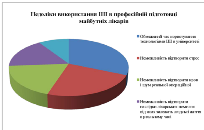
Рис. 5. Недоліки використання технологій ШІ в професійній підготовці очима здобувачів вищої освіти, які навчаються на спеціальності «медицина»

Водночас, респонденти вказували на недоліки використання технологій ШІ в навчальному процесі (див. рис. 5), так серед найбільш вагомих недоліків здобувачі вказували: обмежений час користування технологіями ШІ на практичних заняттях (31,36% респондентів),