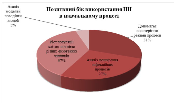
Рис. 4. Позитивний бік використання ШІ в навчальному процесі очами здобувачів вищої освіти, які навчаються на спеціальності «медцина»

Водночас, респонденти вказували позитивні та негативні сторони використання ШІ в навчальному процесі продемонстрував дуже цікаву картину даних (див. рис. 4)