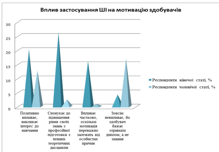
Рис. 7. Вплив застосування ШІ під час проведення практичних занять на мотивацію здобувачів вищої освіти, які навчаються на спеціальності «медicina»

Так, аналізуючи отримані відповіді респондентів, можна зробити висновок про те, що не всі викладачі кафедр теоретичного профілю готові до впровадження технологій ШІ і надають перевагу традиційним методам викладання, оскільки вважають, що тільки так можливо підготувати кваліфікованого спеціаліста. Нерідко, вороже ставлення викладачів до ШІ обумовлено, по-перше низькою цифровою грамотністю та обізнаністю щодо перспектив його використання в освітньому процесі або негативним особистим досвідом роботи з такими програмами, а по-друге не менш серйозним викликом є створення безпечного середовища та умов для використання зазначених вище технологій. Крім того, існує не менш серйозне упередження серед викладачів, яке пов'язане з тим, що з часом ШІ може замінити людину. Саме це також обумовлює обережне і подекуди негативне відношення викладачів до ШІ. Водночас слід розуміти, що наразі традиційні методи викладання є менш ефективними, оскільки покоління здобувачів, яке зараз навчається є більш сприйнятливим до застосування різних цифрових технологій.