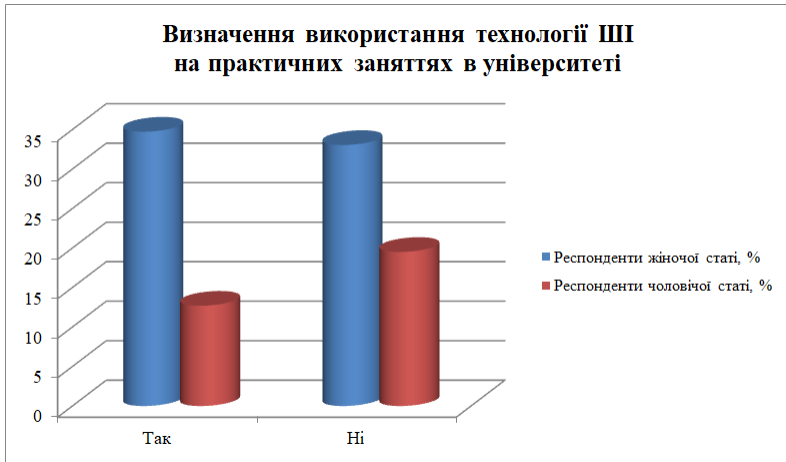
Рис. 1. Використання технології ІІІ на практичних заняттях в університеті