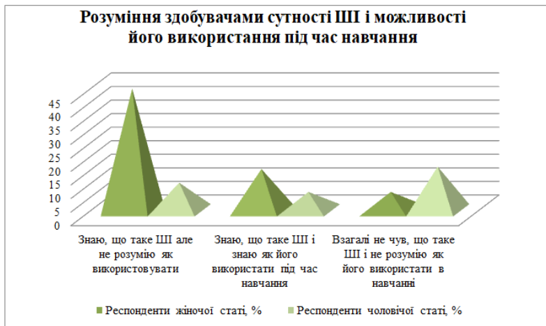
Рис. 2. Встановлення розуміння здобувачами вищої освіти сутності ІІІ і можливостей його використання в навчальному процесі

Визначення інноваційних комп'ютерних технологій, які використовуються на практичних заняттях для здобувачів спеціальності «медичина», показало такий характер даних (див. рис. 3).