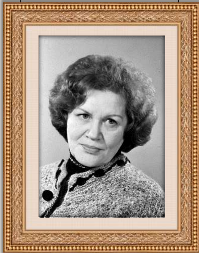
Л.В. КОСТЕНКО (1930)

«Слова росли із ґрунту, мов жита. Добірним зерном колосилась мова. Вона як хліб. Вона свята. І кров'ю предків тяжко пурпурова»