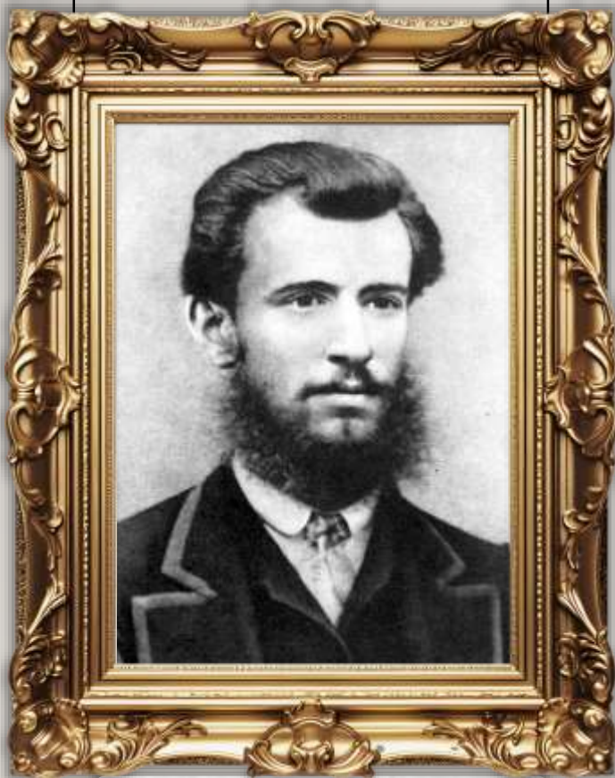
ПАНАС МИРНИЙ (П.Я. Рудченко) 1849–1920

«Найбільше і найдорожче добро кожного народу – це його мова, та жива схованка людського духу, його багата скарбниця, в яку народ складає і своє давнє життя, і свої сподіванки, розум, досвід, почування»