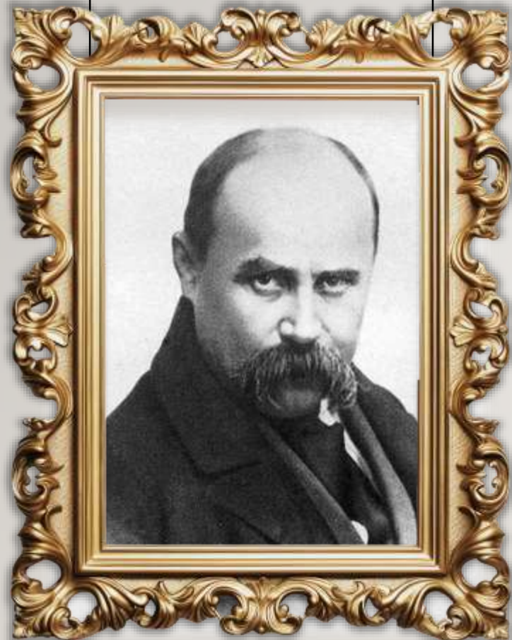
Т.Г. ШЕВЧЕНКО (1814–1861)

«Ну що б здавалося, слова... Слова та голос – більш нічого. А серце б'ється – ожива, Як їх почує!..»