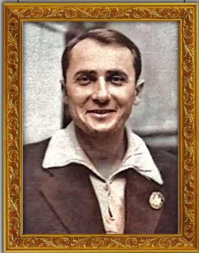
В.М. СОСЮРА (1898–1965)

«Яке прекрасне рідне слово! Воно – не світ, а всі світи»;