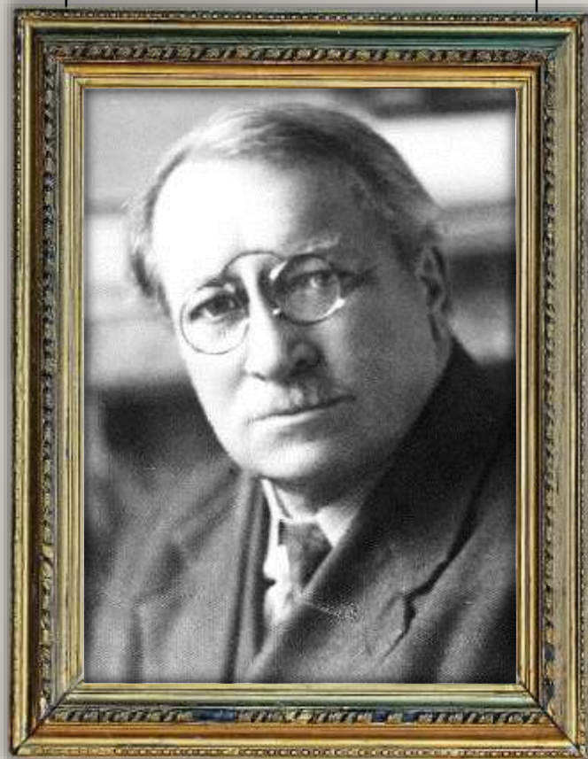
ОЛЕКСАНДР ОЛЕСЬ (О.І. Кандиба) 1878–1944

«Бринить-співає наша мова, чарує, тішить і п'янить»