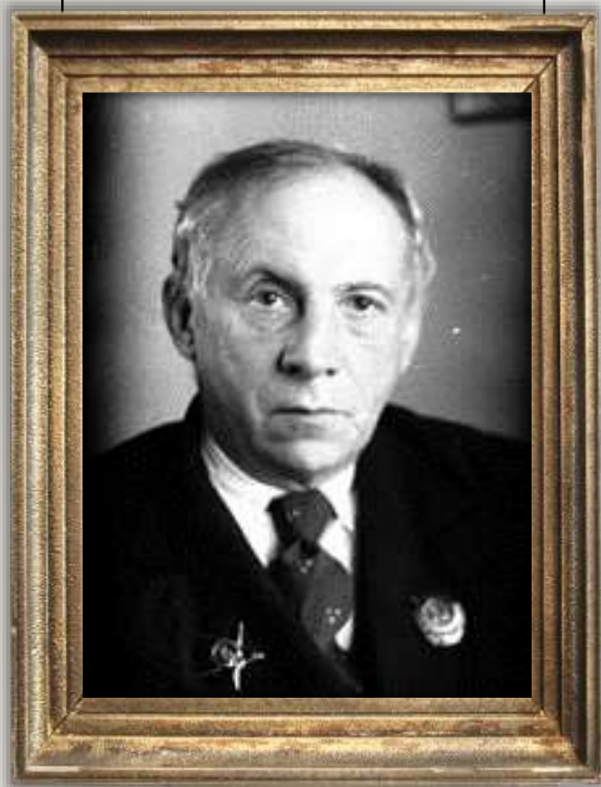
М.Т. РИЛЬСЬКИЙ (1895–1964)

«Мова – втілення думки. Що багатша думка, то багатша мова. Любімо її, вивчаймо її, розвиваймо її! Борімося за красу мови, за правильність мови, за присутність мови, за багатство мови...»