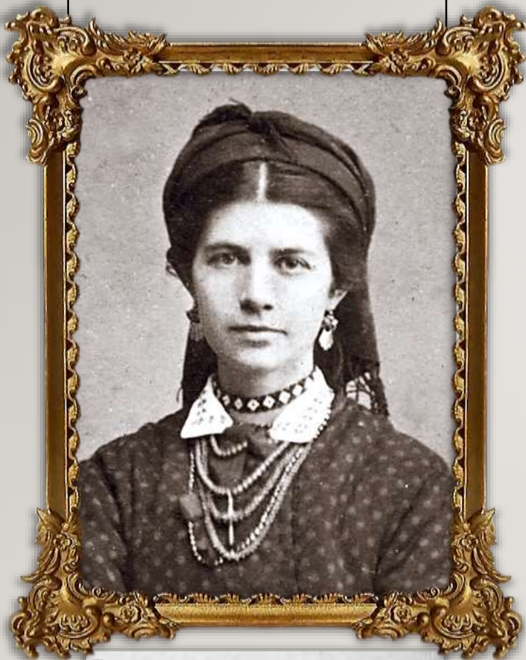
ОЛЕНА ПЧІЛКА (О.П. Косач) 1849–1930