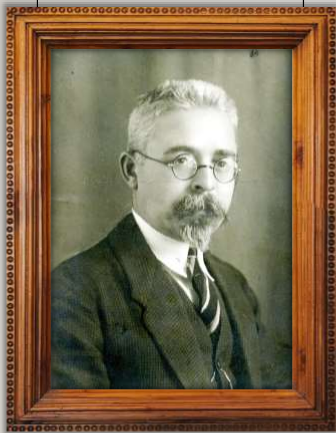
І.І. ОГІЄНКО (1882–1972)

«Народ, що не розуміє сили й значення рідної мови й не працює для збільшення культури її, не скоро стане свідомою нацією й не стоїть на дорозі до державності»