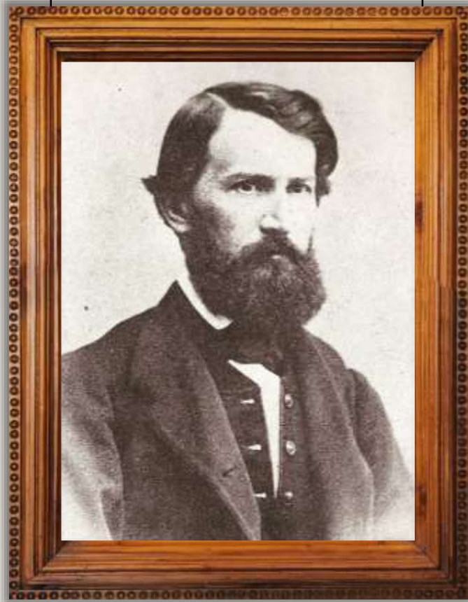
К.Д. УШИНСЬКИЙ (1824–1871)

«Поки жива мова в устах народу, до того часу живий і народ.