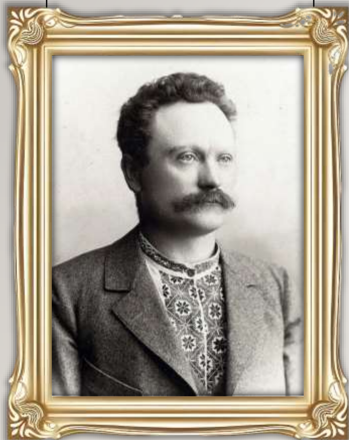
І.Я. ФРАНКО (1856–1916)

«Мова росте елементарно разом з душею народу»;