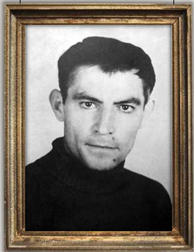
В.С. СТУС (1938–1985)

«Освіта – це вид гігієни. Листьмо з помилками – то як, невимиті руки чи зуби»