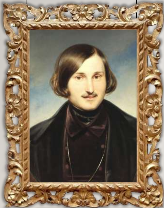
М.В. ГОГОЛЬ (1809–1852)

«Дивуєшся дорогоцінності мови нашої: в ній що не звук, то подарунок, все крупно, зернисто, як самі перла»