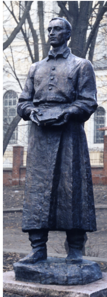
Видатний український філософ та поет ГРИГОРІЙ СКОВОРОДА викладав у Харківському колегіумі, який було засновано у стінах Свято-Покровського монастиря в 1726 році