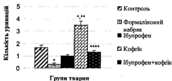
Рис. 5. Вплив ібупрофену, кофеїну та їх композицій на діурез щурів в умовах формалінового набряку