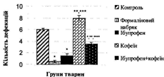
Рис. 6. Вплив ібупрофену, кофеїну та їх композицій на дефекацію щурів в умовах формалінового набряку

**** – різниця статистично вірогідна з моноведенням кофеїну ( P < 0,05 ).