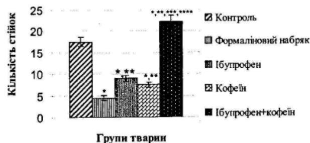
Рис. 2. Вплив ібупрофену, кофеїну та їх композиції на ВРА у щурів в умовах формалінового набряку