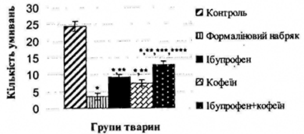
Рис. 4. Вплив ібупрофену, кофеїну та їх композицій на косметичну поведінку щурів в умовах формалінового набряку

При моделюванні формалінового набряку спостерігалось статистично вірогідне зменшення кількості умивань у 7 разів: до 3,50 \pm 0,56 відносно контролю ( 24,50 \pm 0,43 ). При введенні на фоні формалінового набряку ібупрофену, кофеїну та їх композиції спостерігалось статистично вірогідне збільшення грумінгу відносно групи 2 у 2-4 разів: до 9,17 \pm 0,95 (група 3), 7,50 \pm 0,43 (група 4), 13,00 \pm 0,869 (група 5) (рис. 4).