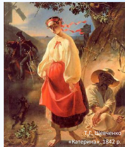
Т.Г. Шевченко «Катерина», 1842 р.