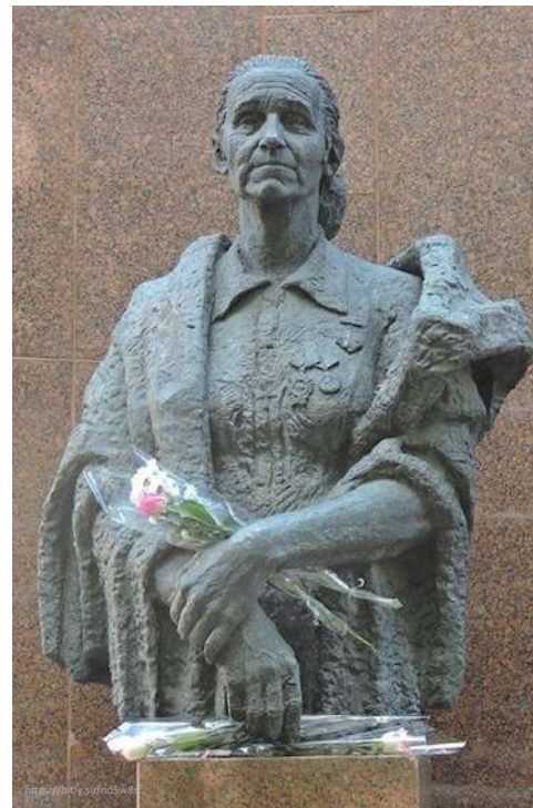
Пам'ятник Олександрі Деревській у Ромнах

Сьогодні в місті Ромни, як і в нашій країні, необхідно багато чого зробити, в першу чергу в економічній і в соціальній сферах, змінити життя її мешканців на краще. Упевнена, що позитивні перетворення будуть, бо живуть тут, як ми вже знаємо, обдаровані і працьовиті люди.