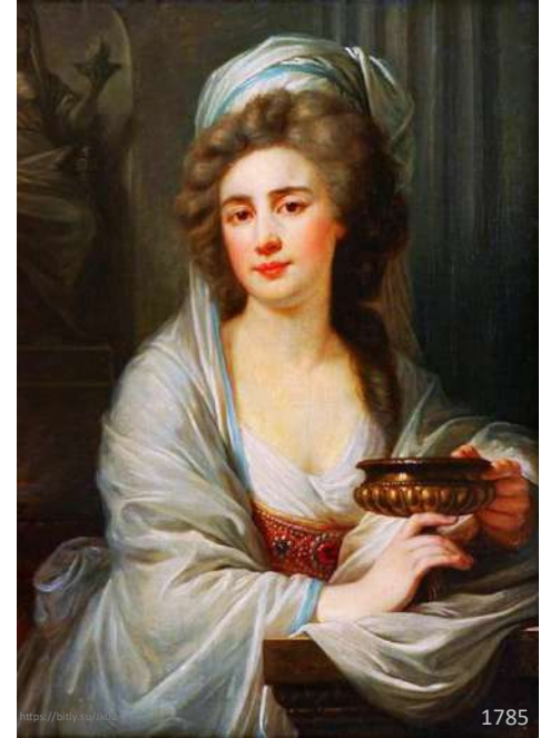
Софія Костянтинівна Вітт-Потоцька (1765-1822)

Неймовірна аура Софіївки так і манить, зачаровує своєю пишною красою та розмаїттям кольорів у будь-яку пору року. Чудовий парк, яким приємно пройти, помилуватися пейзажами, озерами, гротами та іншими цікавинками та й просто відпочити у єднанні з природою...