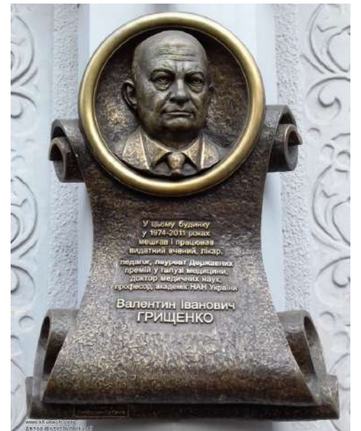
Меморіальна дошка В. І. Грищенку вул. Пушкінська, 67/69