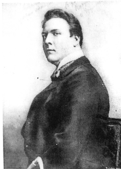
Портрет Ф. И. Шаляпина, подаренный им Т. И. Сурукчи, 1917 г.

на придаточных полостях носа, широко использовались прямые методы исследования верхних дыхательных путей и пищевода, которыми в совершенстве владел С. Г. Сурукчи и щедро передавал свой богатый опыт молодым врачам. Высоким был авторитет