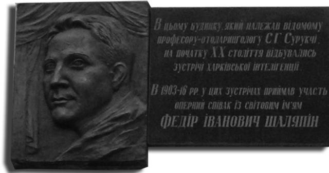
Мемориальная доска на доме № 7 по ул. Чубаря

К этому времени относится еще один факт из жизни С. Г. Сурукчи, который по праву является предметом гордости харьковчан — медиков и искусствоведов. Это знакомство и дружба с великим певцом современности Ф. И. Шаляпиным, который часто бывал с гастролями и антрепризами в Харькове и радовал своим искусством не только интеллигентов-меломанов, но и простых горожан, выступая в театрах и в Народном доме. Еще в 1903 г. у певца начались неполадки с голосом, свя-