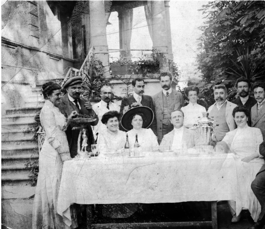
Ф.И. Шаляпин (сидит в центре) в гостях у С.Г. Сурукчи (стоит 3-й справа). 1910 г.

преподнес портрет с собственноручной надписью: «Дорогой Татьяне Ивановне давно обещанный подарок в знак симпатии и дружеского чувства» [1, с. 73].