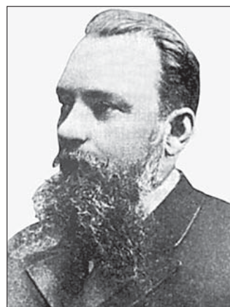
Стуковенков Михайло Іванович (1842—1897), перший завідувач кафедри дерматології і сифілітичних хвороб медичного факультету Університету св. Володимира

Ukrainian Journal of Dermatology, Venerology, Cosmetology