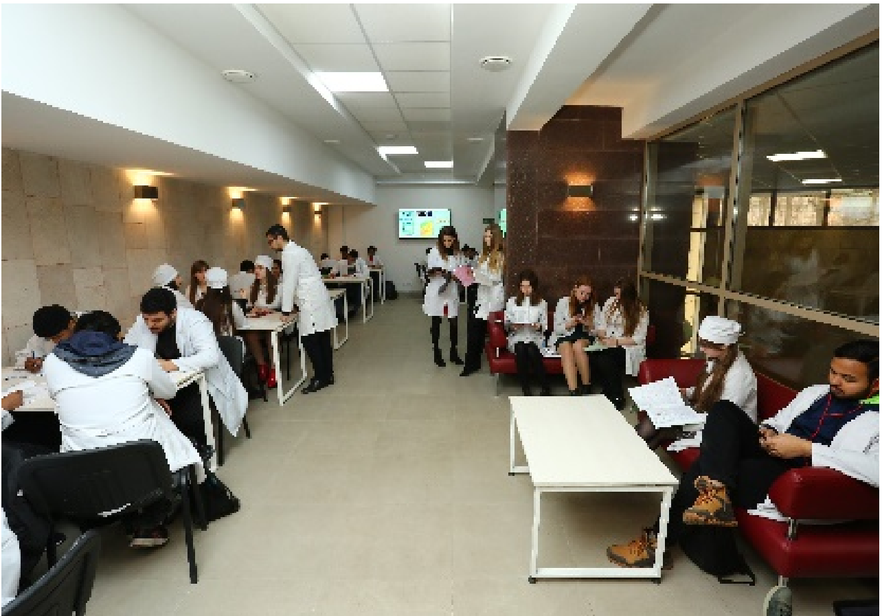
Фото 3. Коворкінг