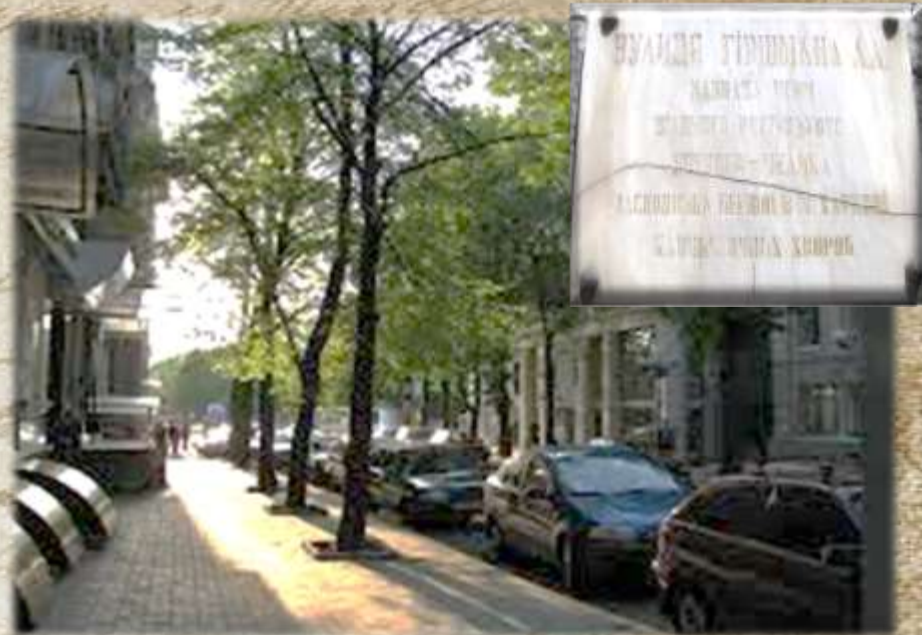
Вулиця імені Л. Л. Гіршмана

На території 14-ї офтальмологічної міської клініки в 2009 р. відкрито бронзовий пам'ятник. На гранітному постаменті – фігури Леонарда Гіршмана і маленької дівчинки, у якої відновився зір завдяки операції доктора. Ця дівчинка – збірний образ всіх тих, кому доктор Гіршман допоміг побачити цей світ у всій його красі