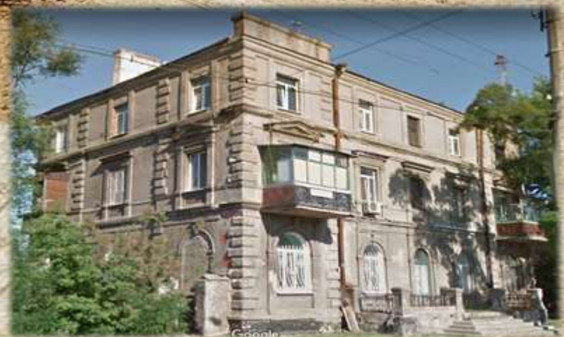
Вулиця Москалівська, 55 – сучасний вигляд будівлі

25 березня 1908 р. на Москалівці, в орендованому приміщенні, на зібрані кошти урочисто відкрито міську очну лікарню на 10 ліжок