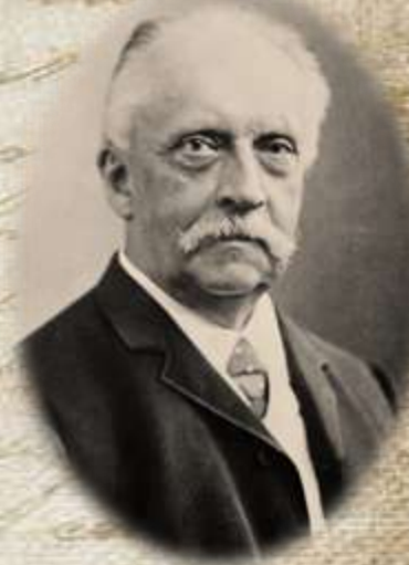
Герман фон Гельмгольц

Гіршман вчиться у відомого фізика, фізіолога і психолога Германа фон Гельмгольца, завідуючого кафедрою фізіології Гейдельберзького університету