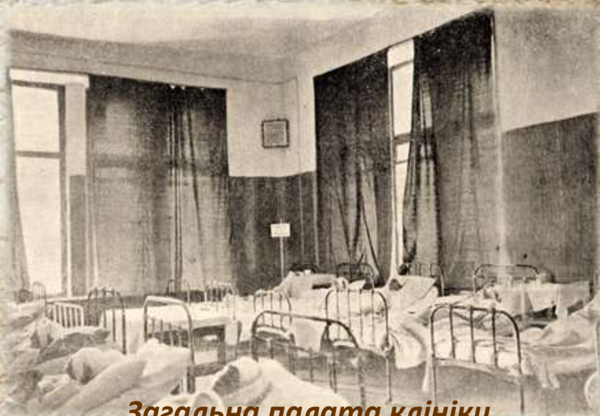
Загальна палата клініки

У 1914 р. Харківська Дума надала Леонарду Гіршману звання Почесного громадянина Харкова