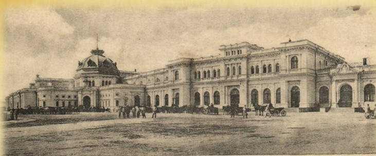
Харьков. — Вокзал.

Харьков не был готов к такому неожиданному и огромному числу беженцев. Первая волна беженцев немцев-колонистов принесла с собой эпидемии. Санитарный надзор города обратился к общественности. Неса большие потери человеческих жизней, с проблемой удалось справиться. Следующая волна беженцев, прошедшая транзитом через Харьков, показала верх организованной деятельности волонтеров.