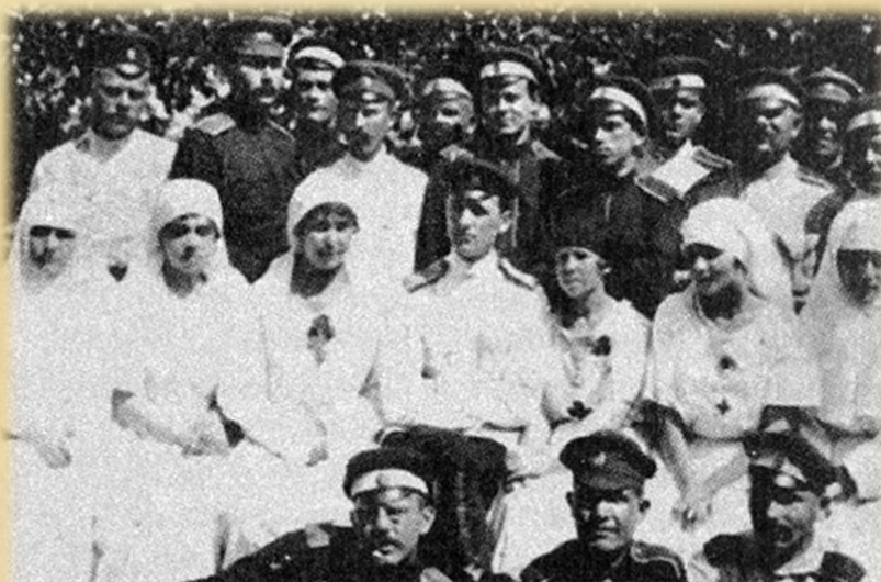
Солдаты Дроздовского полка и сёстры милосердия в харьковском госпитале