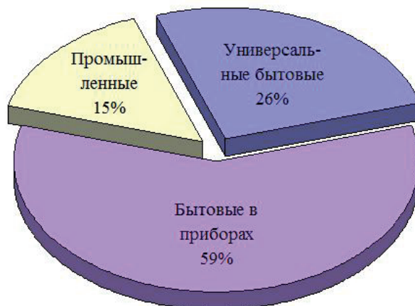
Рис. 2. Распределение никель-кадмиевых аккумуляторов по виду использования

Следует отметить, что проблема утилизации вторичных источников питания является не только технологической, но также и экологической, поскольку уникальные физико-химические свойства соединений этого химического элемента являются одновременно и источником вредного влияния на окружающую среду и в частности на здоровье человеческого организма [8–17].