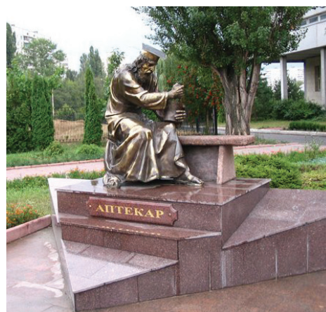
Скульптура «Аптекарь», ул. Блюхера, 4, территорія Національного фармацевтичного університету

«Медицинский университет» Реєстраційне свідоцтво ХК № 193 від 29 червня 1994 р. Засновник – Колектив Харківського національного медичного університету. Газета виходить один раз на місяць Адреса редакції: 61022, Харків, пр. Леніна, 4. Гол. корпус, 5 поверх, тел. 707-73-60 e-mail: redakt@knmu.kharkov.ua www.knmu.kharkov.ua