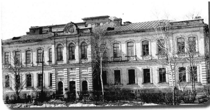
Стара будівля кафедри

а згодом – доцент кафедри. Під його керівництвом у науковій роботі кафедри не тільки продовжується вже розроблений напрямок патогенетичного обґрунтування лікування інфекційних хвороб, але й виконується активний пошук нових шляхів і можливостей розвитку наукових досліджень, вивчається стан компенсаторних механізмів адаптації до інфекційного процесу та удосконалюються медикаментозні й немедикаментозні засоби у лікуванні хвороб, що спричиняються бактеріями, вірусами та їх асоціаціями.