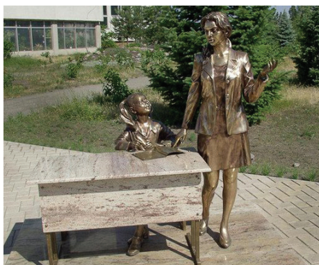
Пам'ятник першої учительниці, ул. Блюхера, 2, территорія Харківського національного педагогічного університету ім. Г. Сковороди