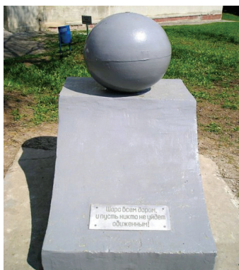
Пам'ятник «шаре», ул. Чкалова, 17, район Лесопарка