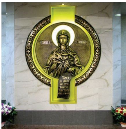
Барельєф святої Тат'яни, вестибюль станції метро «Університет»