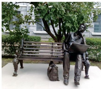
Пам'ятник студенту-програмісту, вхід в Харківський національний університет радіоелектроніки