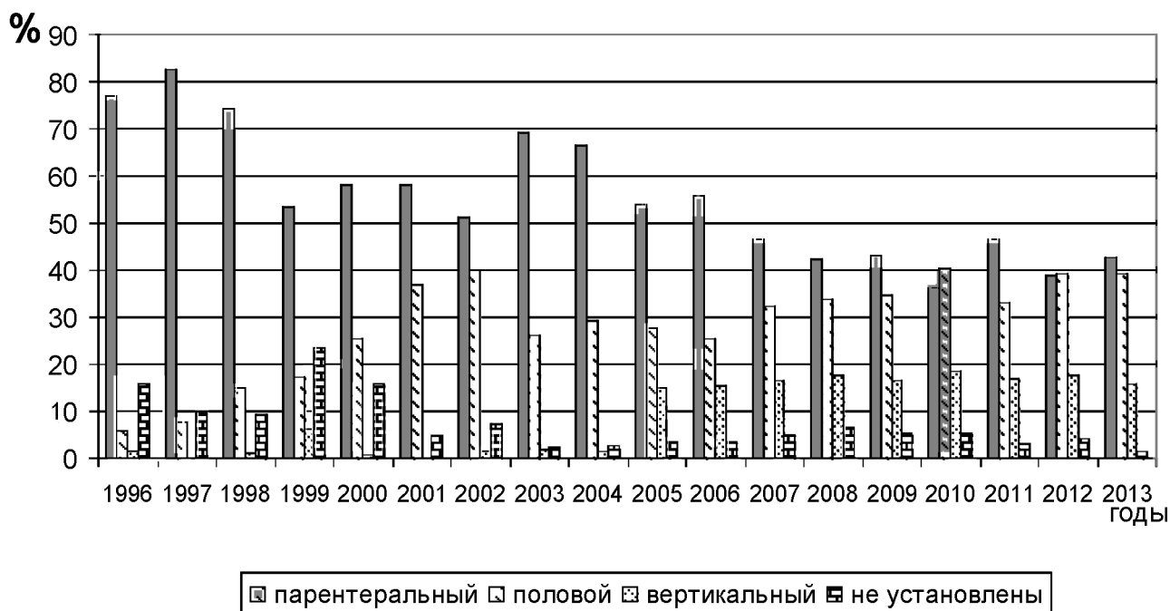
Рис.2. Структура путей передачи ВИЧ-инфекции в Харьковской области за 1996 – 2013 гг.

Полученные результаты можно объяснить широким распространением наркомании, связанной с групповым употреблением наркотических веществ кустарного производства, для осаднения которых использовалась нативная кровь одного из наркоманов, использованием общих шприцов и игл [2, 4-6]. В этот период времени основной группой риска инфицирования ВИЧ явились потребители инъекционных наркотиков. Опасность этой категории лиц для распространения ВИЧ-инфекции заключается не только в том, что они рискуют заразиться при совместном употреблении наркотиков, но и в том, что эти лица склонны к рискованному сексуальному поведению, и могут послужить источниками инфекции для своих половых партнеров, которые не являются ВИЧ-инфицированными. Таким образом эпидемия ВИЧ-инфекции может из концентрированной стадии эпидемии, сосредоточенной в группах поведенческого риска, перейти в генерализованную, т.е. распространиться на все население.