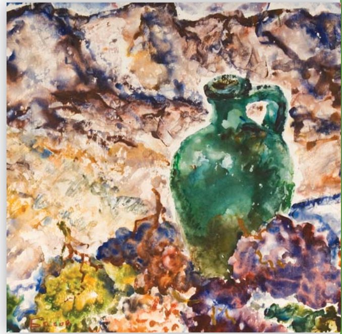
Басов Яків Олександрович. Осінь у Криму. 1985. Папір, акварель