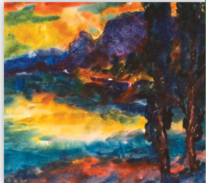
Басов Яків Олександрович. Захід сонця над Селізом. 1988. Папір, акварель