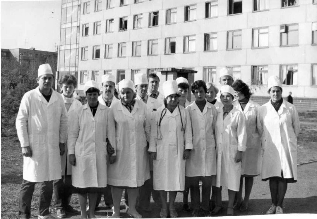
Колектив кафедри інфекційних хвороб ХМІ поблизу нового приміщення клінічної інфекційної лікарні № 22, 1980 р.