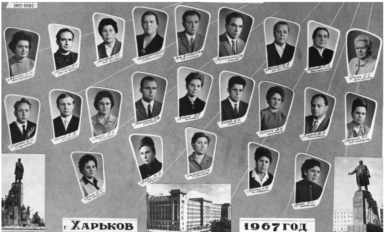
Колектив кафедри інфекційних хвороб Харківського медичного інституту з керівним складом 22-ої інфекційної лікарні м. Харкова, 1967 р.