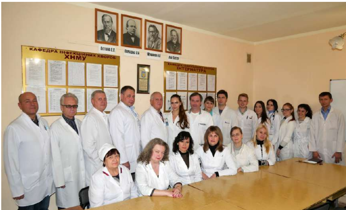
Колектив кафедри інфекційних хвороб Харківського національного медичного університету сьогодні.