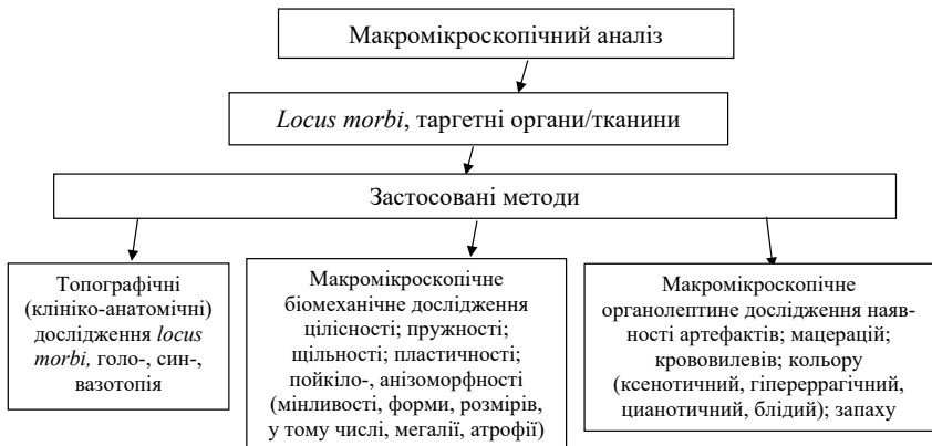
Рис. 1. Схема-алгоритм макромікроскопічного аналізу матеріалів / ЗБМ дослідження

Оцінка клініко-анатомічної (топографічної) специфіки locus morbi полягала у ретельному вивченні особливостей їхньої просторової конфігурації, локалізації у звичній/тривіальній системі площин (фронтальна, сагітальна, горизонтальна), вісей (вертикальна, сагітальна, поперекова) та координат (OX; OY; OZ), білатеральної симетрії ( dexter/sinister ), сегментної орієнтації ( anterior/posterior, cranialis/