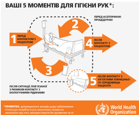
Рис. 3. П'ять показань до проведення гігієнічної обробки рук