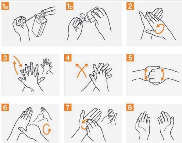
Рис. 2. Техніка гігієнічної обробки рук