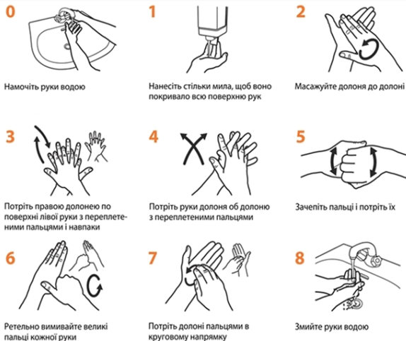
Рис. 1. Техніка миття рук