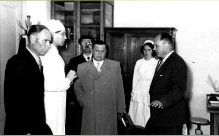
Новостворений Тернопільський медичний інститут відвідав міністр охорони здоров'я УРСР П.Л. Шупик (1959)

За безпосередньої участі вченого відкрито 4 медичні інститути: в Луганську, Запоріжжі, Тернополі, Полтаві