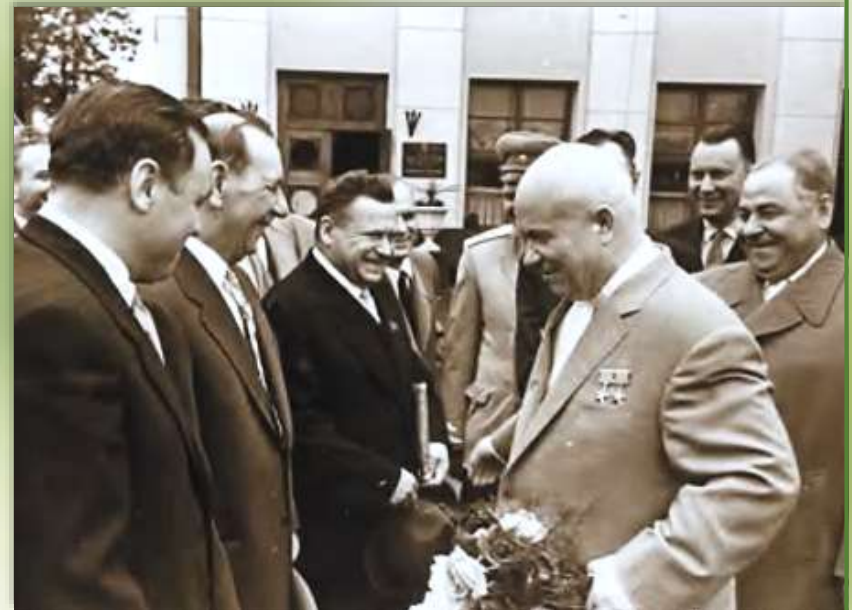
Міністр охорони здоров'я П.Л. Шупик зустрічає керівника уряду України М.С. Хрущова (1961)

За безпосередньої участі вченого відкрито 4 медичні інститути: в Луганську, Запоріжжі, Тернополі, Полтаві