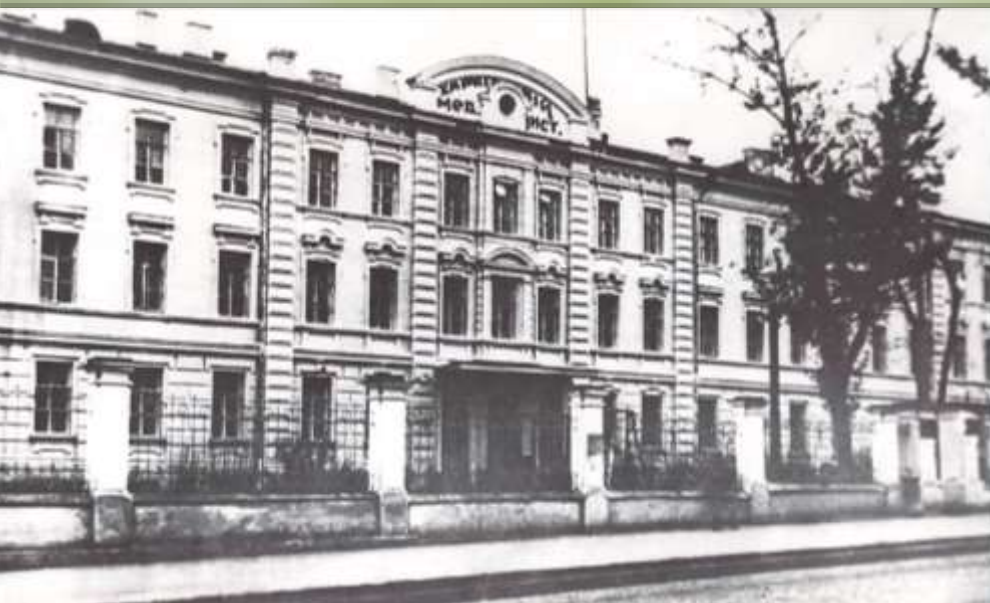
1-й Медичний інститут (вул. Сумська, 41) Будинок зруйновано під час Другої світової війни

У 1927 р. Платон Шупик став студентом лікувального факультету Харківського медичного інституту (нині Харківський національний медичний університет)