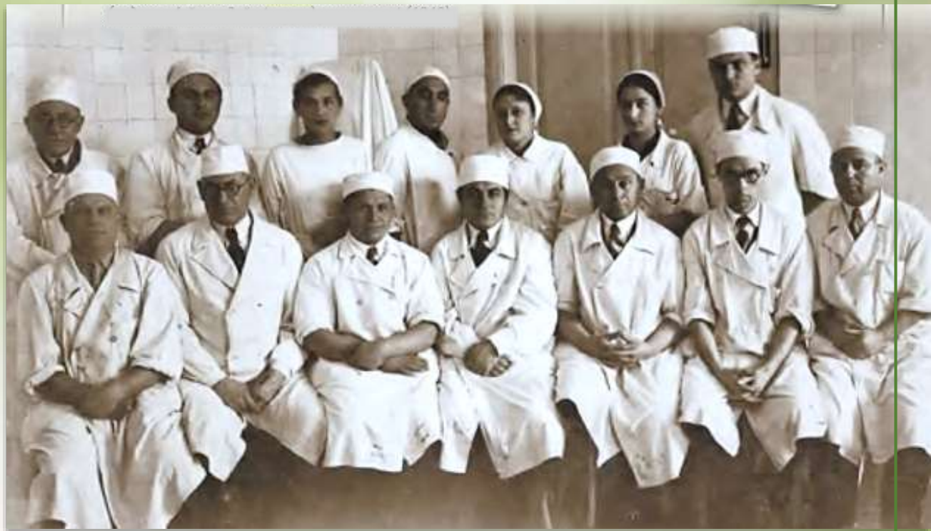
У шпиталі (1940)