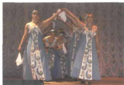
Російський танок у виконанні ансамблю «Радість»

Приємно, що студенти ХНМУ не лише ставлять зразкові номери на вузівських заходах, а й прославляють рідний ВНЗ і за його стінами.