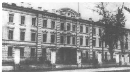
Гістологічний корпус ХМІ, де була розташована бібліотека в довоєнні часи

вою видавати лише в тих випадках, коли відповідного підручника укрмовою у книгозбірні немає, або є в дуже обмеженій кількості.