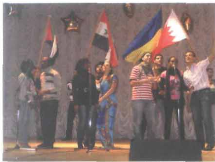
Виконавці пісні «We are the World»

вами голосів, переходом з одного тону на інший, плавною зміною інтонації привернув увагу чаруючий спів сьгоднішніх дебютантів – жіночого вокально-хорового ансамблю (керівник – Н.С. Корецька). Вони виконали спільну композицію разом із го-