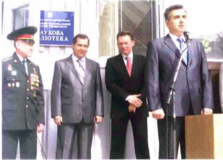
Відкриття урочистої церемонії