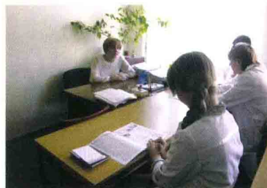
Під час уроку пам'яті