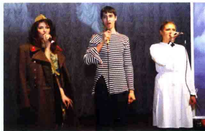
Під час концерту

У перші дні війни на фронт пішли 232 співробітники Харківського медичного інституту, серед них один професор, 4 доктори медичних наук, 13 доцентів, 25 кандидатів наук, а також 122 студенти. Серед понад 1441 лікаря більшість пішли на фронт.