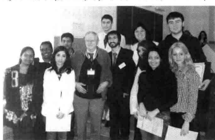
Професор Н. Holdener та учасники конгресу

У заході взяли участь 66 молодих вчених та студентів з Росії, Білорусі, Польщі, Сербії, Болгарії, Бразилії та різних куточків України (Харкова, Києва, Івано-Франківська, Полтави, Донецька, Одеси, Дніпропетровська, Чернівців, Луганська, Сум, Тернополя, Вінниці, Запоріжжя, Сімферополя).