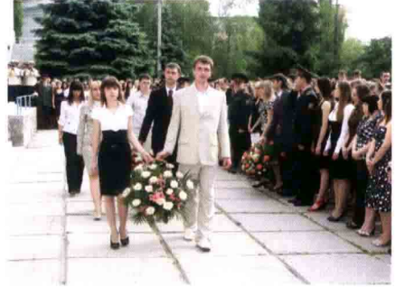
Покладання квітів до Пам'ятного знака

Студенти урочисто поклали квіти до Пам'ятного знака студентам та співробітникам Харківського медичного інституту, що загинули в роки Великої Вітчизняної війни, на вірність священній справі й нетлінній пам'яті про мужній подвиг наших пращурів.