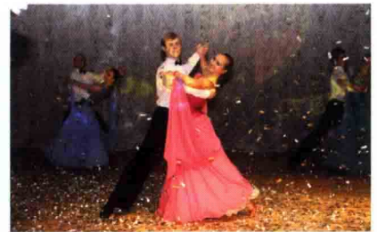
Вальс для ветеранів