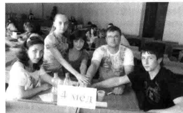
Команда знатоков IV медфакультета