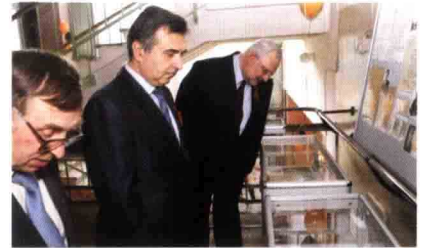
Знайомство з матеріалами виставки