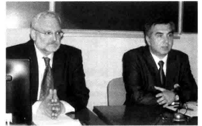
На засіданні вченої ради

За результатами обговорення основної доповіді вчена рада затвердила відповідне рішення.