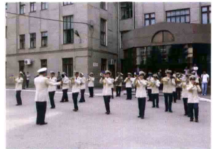
Оркестр Військової академії