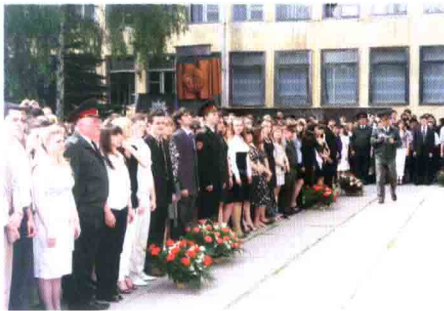
Студенти складають присягу