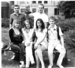
Команда стоматфакультета – победитель игры