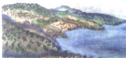
Залив. Автор проф. С.Ю. Масловский