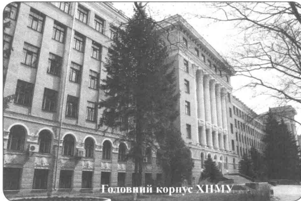
Головний корпус ХНМУ

1.3. Обсяг прийому на I курс навчання за освітньо-кваліфікаційними програмами «бакалавра», «спеціаліста» та «магістра» за рахунок видатків державного бюджету визначається щорічно МОЗ України, у підпорядкуванні якого