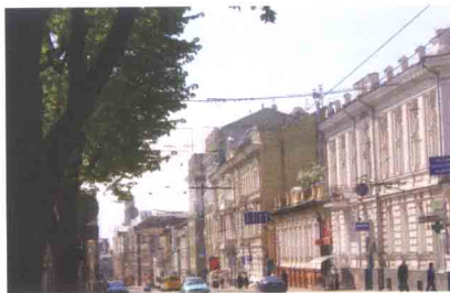
Улицы любимого города.