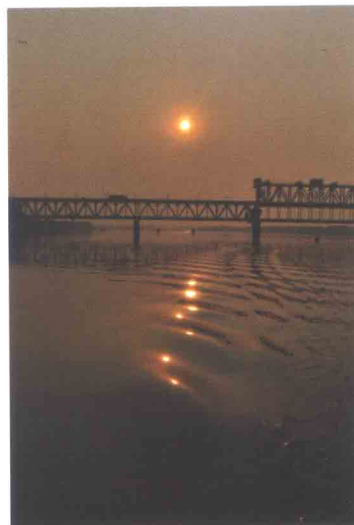
Рассвет на Днепре. Автор ас. А.Ю. Титова

Професія лікаря має давні джерела, які витікають з глибини віків. Щоб оволодіти нею, потрібен неабиякий хист, складовою якого є талант, творчість, політ фантазії, а головне – необхідно творити, тобто бути митцем своєї справи. Колектив Харківського національного медичного університету багатий на таланти, має розвинене почуття прекрасного, яке об'єднує його в прагненні стати духовно багатшим. У нашій газеті започаткована рубрика арт-терапія, оскільки творчість співробітників університету є невичерпним джерелом натхнення. У червні 2009 року в університеті відкрито художню галерею митців, де представлені різноманітні жанри картин співробітників та студентів ХНМУ – живопис, вишивка та фотороботи.