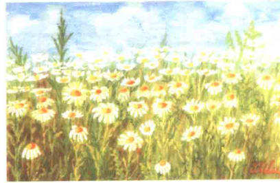
Ромашки. Автор проф. В.Н. Хворостинка