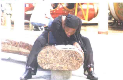
Студентка Сорбонни.