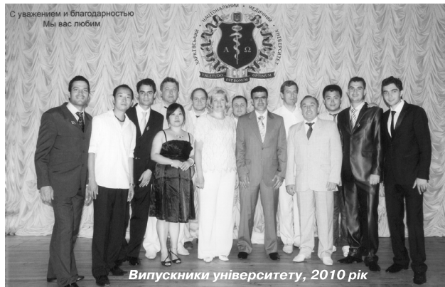
Випускники університету, 2010 рік