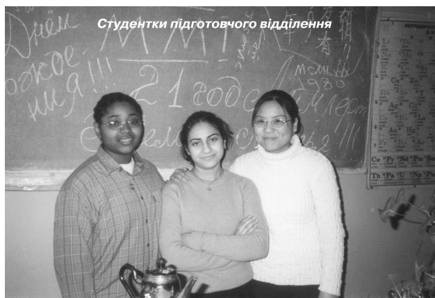
Студентки підготовчого відділення

На жаль, 2 грудня 2011 року вітчизняна наука, медицина та освіта зазнала великої втрати: прекрасний педагог, учений і клініцист Борис Євгенович Гречанін пішов з життя.