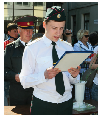
Прийняття присяги студентами НФУ