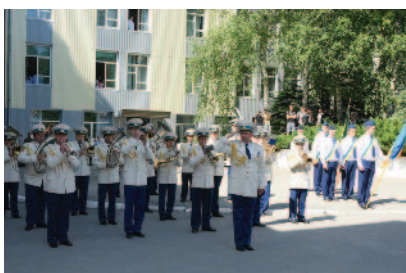
Музичне вітання оркестру військової Академії