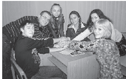
Победители – команда IV медфакультета

Первый тур вопросов, а их было 15, пролетел очень быстро, 7-й вопрос был суперблицем, т.е. за столом оставался лишь один игрок, отвечавший на 3 вопроса подряд.