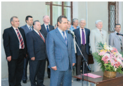
Привітання проф. В. А. Капустника