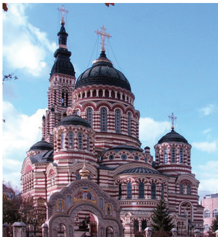
Кафедральный Благовещенский собор