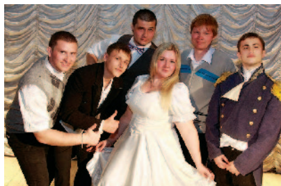
Победители «Осторожно, харьковчане!»

Команды удивляли зрителей и жюри различными стилями игры – от классиче-