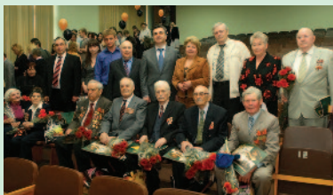
Фото з ветеранами