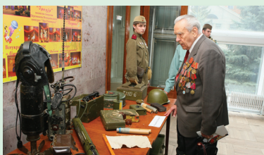
Знайомство з експозицією