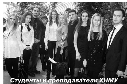
Студенти і преподаватели ХНМУ

11 апреля 2011 года кафедра стоматологии НИУ Белгородского государственного университета в рамках научной сессии провела студенческую научно-практическую конференцию с международным участием, на которую были приглашены студенты и преподаватели стоматологического факультета Харьковского национального медицинского университета.