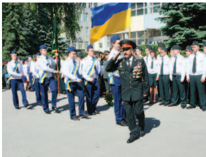
Винос прапора України та прапора ХНМУ