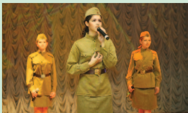
Студенти вітають ветеранів

Напередодні Дня Великої Перемоги в актовому залі Харківського національного медичного університету відбувся святковий концерт. У цей день ми знову й знову славимо безсмертний подвиг воїнів-переможців, і наш священний обов'язок – висловити подяку кожному, хто в грізні роки на передовій і в тилу захищав та звільняв рідну землю.