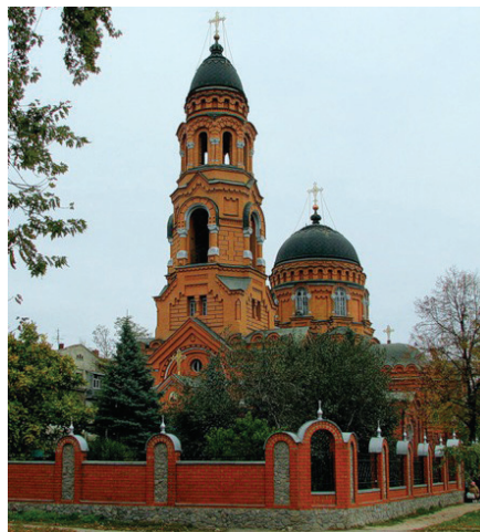
Церковь Озерянской Божьей матери

«Медичний університет» Реєстраційне свідоцтво ХК № 193 від 29 червня 1994 р. Засновник – Колектив Харківського національного медичного університету. Газета виходить один раз на місяць Адреса редакції: 61022, Харків, пр. Леніна, 4. Гол. корпус, 5 поверх, тел. 707-73-60 e-mail: redakt@knuu.kharkov.ua www.knuu.kharkov.ua