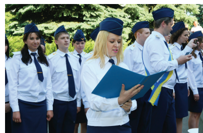
Прийняття присяги студентами ХНМУ