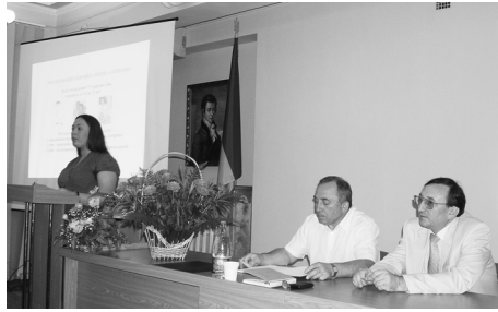
Захист магістерської роботи

Методологія проведення випускних іспитів для бакалаврів відпрацьована ще у попередньому році, обрані випускаючі кафедри та бази для ККДІ й КТТДІ окремо.