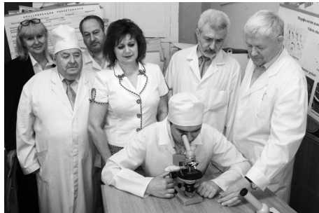
Державний іспит у бакалаврів

Для студентів-бакалаврів підготовлені методичні вказівки щодо структури та методики проведення кожного іспиту, які видані типографським способом. Такий методичний супровід є необхідним для студентів і дозволяє їм краще орієнтуватися під час проведення іспиту. Рівень підготовки бакалаврів як за напрямом підготовки «Сестринська справа», так і «Лабораторна діагностика» виявився на достатньо високому рівні. Уперше в 2012 році випускаються медичні сестри з освітньо-кваліфікаційним рівнем «магістр», які згідно з програмою захищали свої науково-кваліфікаційні роботи.