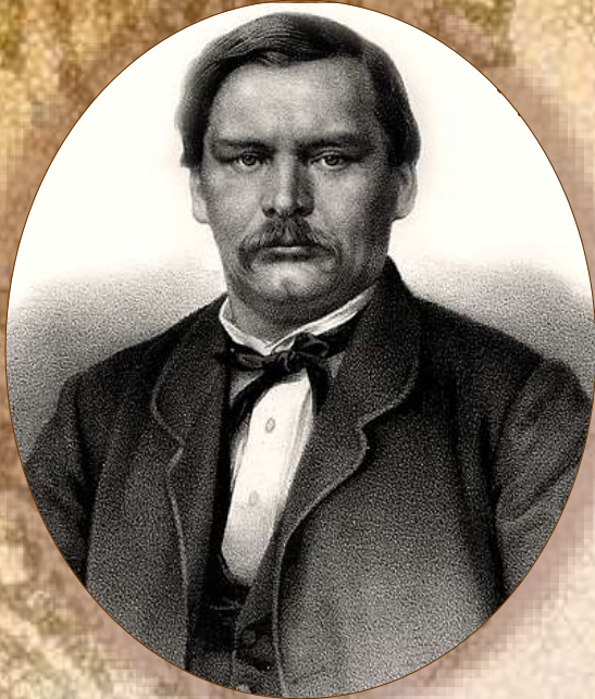
Професор А.Я. Красовський