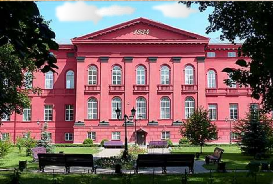
Червоний корпус Київського національного університету ім. Т.Г. Шевченка (1834 р.) – головний і найстаріший корпус університету (вул. Володимирська, 60)

Ведення теоретичного курсу з гінекології поєднував з практичною діяльністю у міських лікарнях. Гінекологічні операції проводив у присутності студентів