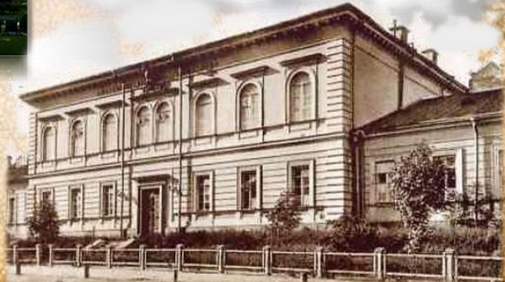
З 1973 р. – Національний музей медицини України (вул. Богдана Хмельницького, 37)