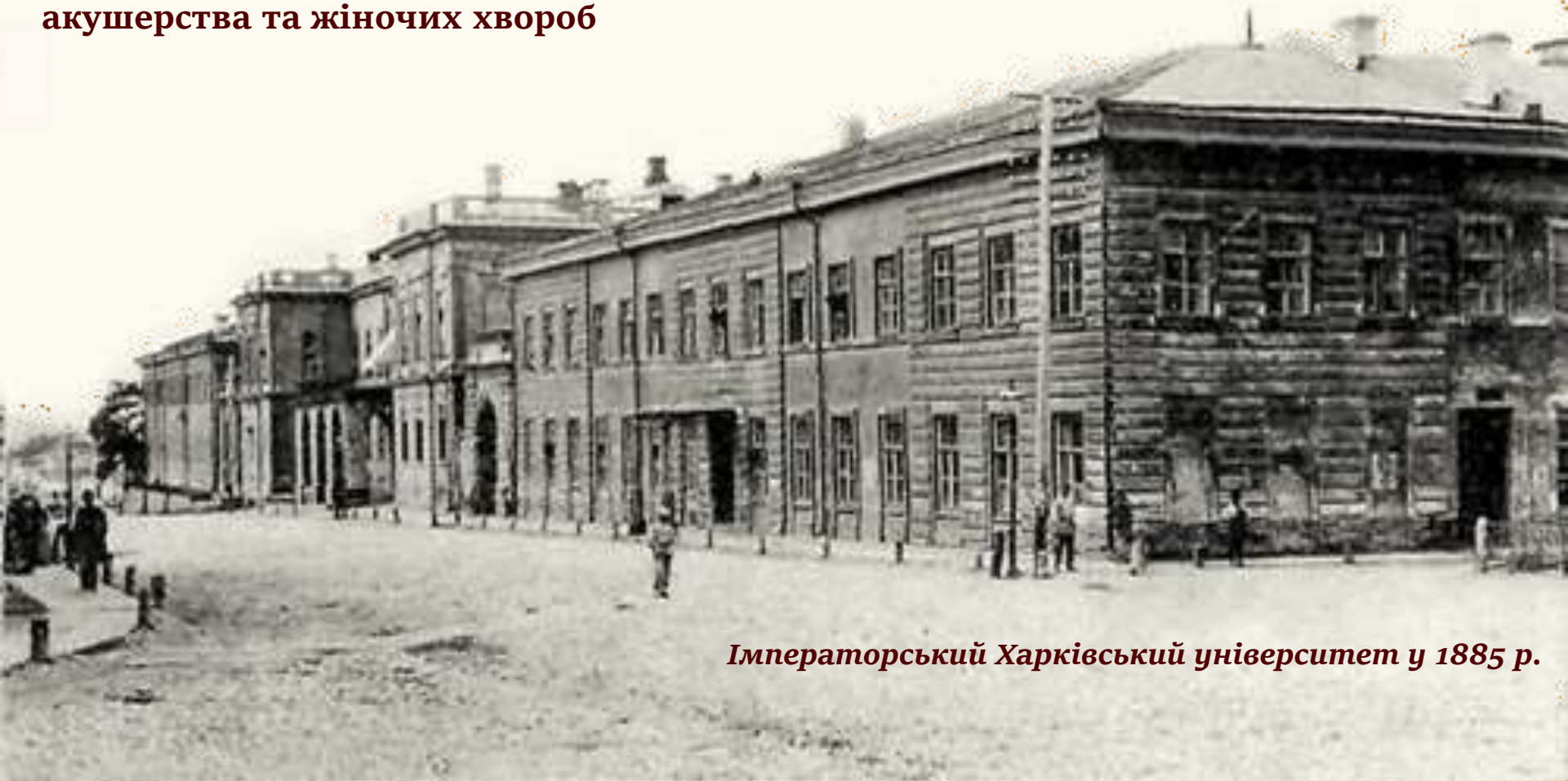
Імператорський Харківський університет у 1885 р.