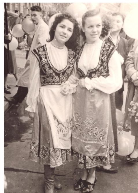
Заняття художньою гімнастикою та народними танцями