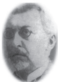
Осипов І.П. — зав. каф. неорганічної хімії Харківського університету (1894—1910 рр.)