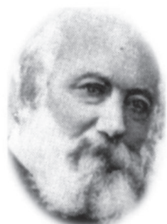
Бекетов М.М. — зав. каф. хімії Харківського університету (1855—1887 рр.)