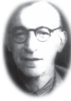
Асс Т.В. — зав. каф. неорганічної та загальної хімії ХМІ (1930—1955 рр.)