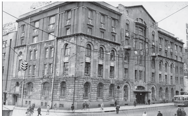
Рис. 4. Корпус Харківського медичного інституту (вул. Сумська, 1), де знаходилася кафедра до 1971 року (1920—1971 рр.)

Тоді кафедра хімії знаходилася за адресою — вул. Сумська, 1.