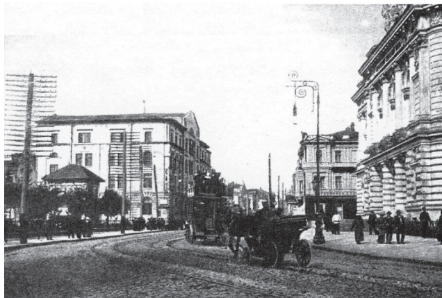
Рис. 2. Жіночий медичний інститут (1910—1920 р.р.), де знаходилася кафедра на початку свого існування

то його робіт було присвячено дослідженню тонкої структури органічних сполук: вивчена реакційна спроможність деяких функціональних груп, таутомерія та ізомерія, утворення міжмолекулярного водневого зв'язку у розчинах та ряд інших питань.