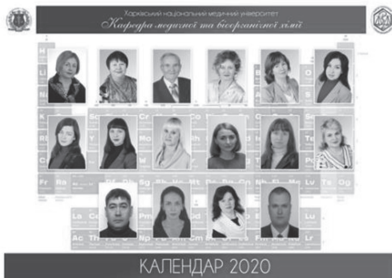
Рис. 10. Монографії з історії кафедри та ювілейний календар