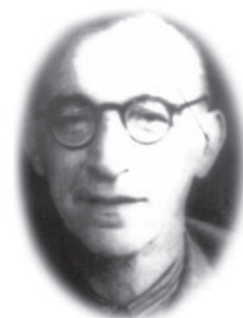
Рис. 7. Професор Т.В. Асс

«хромовання металів» отримання бромів. Товій Вікторович дбав також про технічне оснащення кафедри, та створив оптимальне технічне забезпечення навчальної та наукової роботи. Його наукова школа розвивала не лише інтереси загальної та фізичної хімії але й також медицини, працюючи у тісному тандемі наук. Товій Вікторович був людиною, науковцем та викладачем з великої літери, його однаково поважали і співробітники і студенти