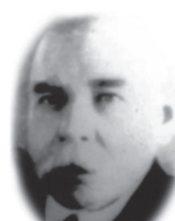
Валяшко М.О. — зав. каф. аналітичної хімії Харківського університету (1910—1922 рр.)