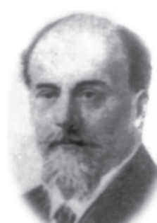
Тимофеев В.Ф. — зав. каф. органічної хімії Харківського університету (1897—1904 рр.)