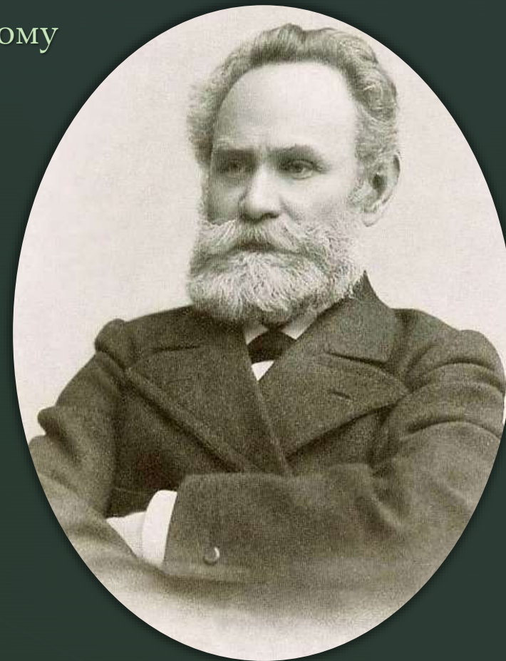
Іван Петрович Павлов

«Він підкоряв собі аудиторію переконливістю, зрозумілою, суворою послідовністю викладу фактичного матеріалу. У тоні його не було ні докторальності тодішніх професорів, ні претензії на красномовство. Лекція полягала в демонстрації досвіду, і все, що говорив професор, було лише поясненням спостережуваних слухачами фактів. Ця лекція відрізнялася від усіх лекцій, які я до цього слухав», – писав Георгій Володимирович