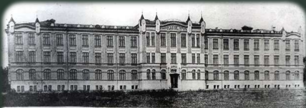
Новое здание химического института харьковского университета.

На підставі подання академіка В.Я. Данилевського та рекомендації академіка І.П. Павлова Вчена рада Харківського медичного інституту обирає професора Г.В. Фольборта завідувачем кафедри нормальної фізіології, яку він очолює до 1945 р.