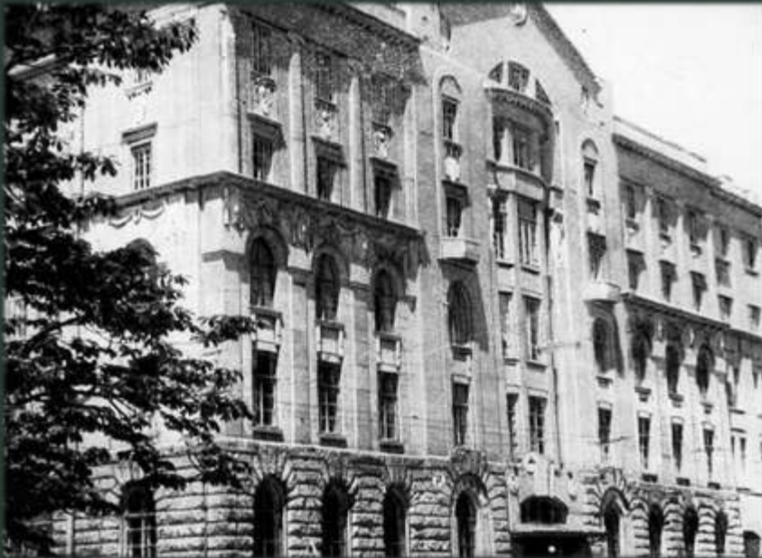
Перша будівля Жіночого медичного інституту. До Другої світової війни – Український інститут експериментальної медицини. Вул. Сумська, 1

Після звільнення Харкова від окупантів Фольборт повертається до Харкова. Довелося починати викладання у непристосованому для цього приміщенні – Медичний інститут тимчасово розташувався у будинку на вул. Сумській, 1