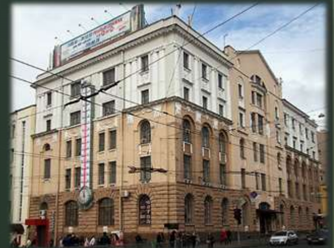
Сучасний вигляд будівлі

Після звільнення Харкова від окупантів Фольборт повертається до Харкова. Довелося починати викладання у непристосованому для цього приміщенні – Медичний інститут тимчасово розташувався у будинку на вул. Сумській, 1