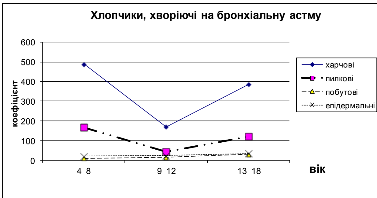
Рисунок 1. Номограма для встановлення причинно-значущого алергену при бронхіальній астмі у хлопчиків залежно від їх віку.

Аналогічно у дівчаток віком 4-8 років, хворих на БА, переважала харчова та пилкова алергія, яка зменшувалась до 9-12 років та не змінювалась до 13-18 років (++). Вікова динаміка чутливості до пилкових алергенів аналогічна хлопчикам. Реакція на побутові та епідермальні алергени була помірною в 4-8 років (++), дещо зменшувалась у 9-12 років (+) та зростала в 13-18 років (++) (таблиця 3).