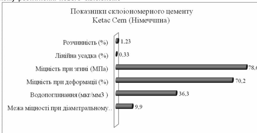
Рис. 1. Фізико-механічні властивості склоіономерного цементу «Ketac Cem» (Німеччина)

цементу для постійної фіксації не має достовірної відмінності в порівнянні з його закордонними аналогами ( p > 0,05 ) (рис. 1).