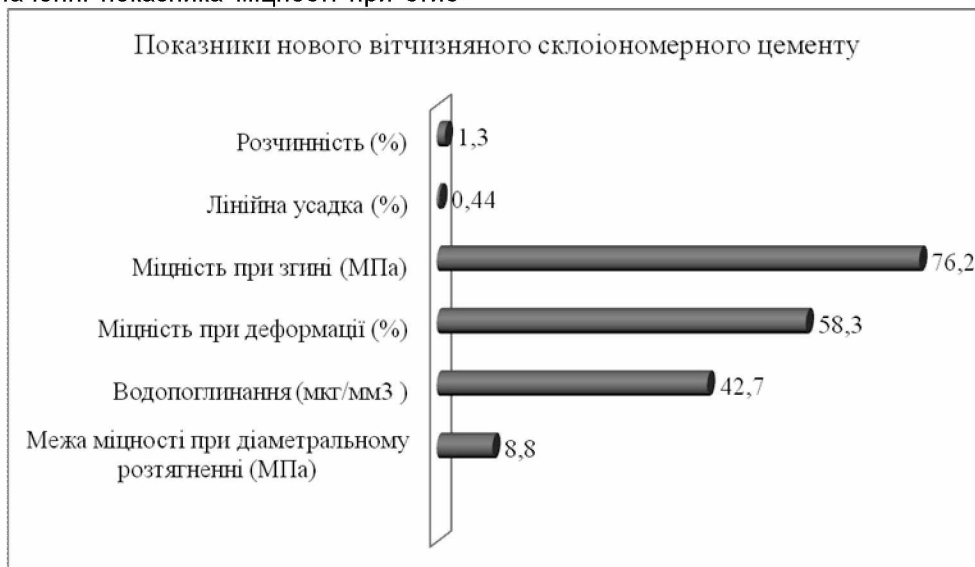
Рис. 3. Фізико-механічні властивості нового вітчизняного склоіономерного цементу

канні було встановлено, що результати характеризуються несуттєвою різницею між показниками: розроблений цемент – 76,2 \pm 0,4\% МПа, що достовірно ( p < 0,05 ) на 2,4 \pm 0,1\% менше за «Ketac Cem» – 78,6 \pm 0,5\% , але не має достовірної різниці ( p > 0,05 ) між розробленим матеріалом і «Riva», показник якого – 76,0 \pm 0,8\% відповідно (рис. 3).