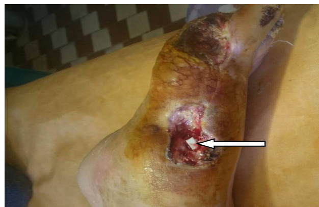
Рис. 4. Пациент К., 68 лет. Вид раны после хирургической обработки и установки костного имплантата (показан стрелкой)