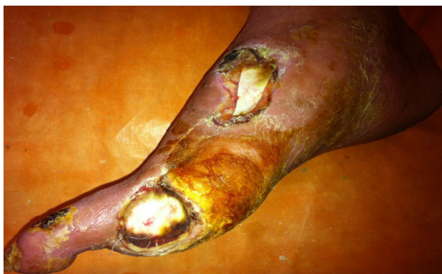
Рис. 6. Пациент К., 68 лет. Раны закрыты синтетическим покрытием PCL (вид ран на 3-и сутки после манипуляции)