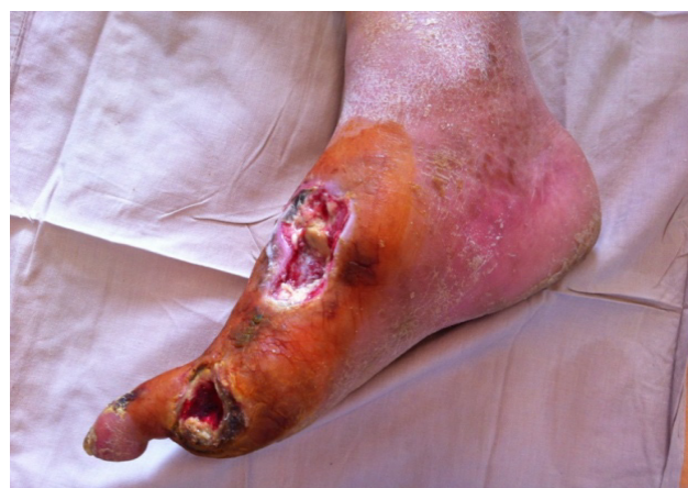
Рис. 3. Пациент К., 68 лет. Вид раны после ФДТ (3-и сутки после операции)