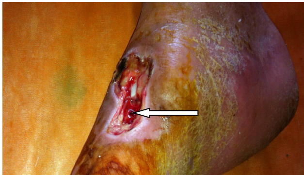
Рис. 5. Пациент К., 68 лет. На рану нанесен фибриновый сгусток (показан стрелкой)