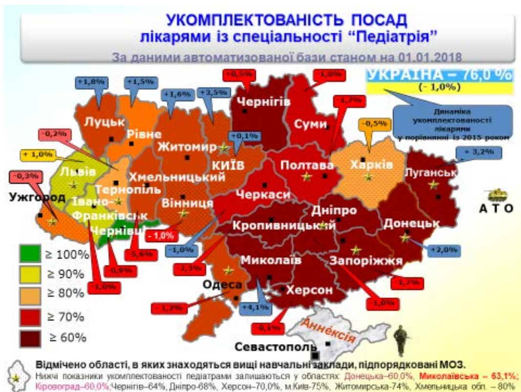
Рис. 1. Укомплектованість посад лікарями зі спеціальності «Педіатрія» за даними автоматизованої бази станом на 01.01.2018

Зараз найнижчі показники укомплектованості дитячими лікарями спостерігають в закладах охорони здоров'я у таких областях, як Донецька –60,0 %, Миколаївська – 63,1 %; Кіровоград – 60,0 %; Чернігів – 64 %, Дніпро – 68 %, Херсон – 70,0 %, м. Київ – 75 %, Житомирська – 74 %, Хмельницька обл. – 80 % (рис.1).