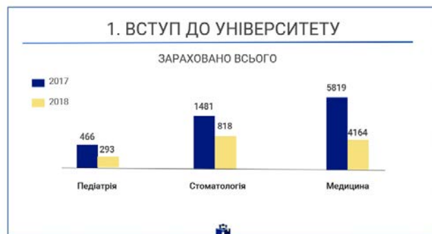
Рис. 2. Вступ до університету.

Внаслідок запроваджених новацій при вступі (системи широкого конкурсу та встановлення порога зарахування у 150 балів) до ЗВО у 2018 р. заклади вищої медичної освіти не змогли прийняти на перший курс на місця державного замовлення понад 700 осіб.